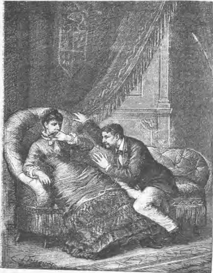
Y le tomó nuevamente las manos.

Recordó Gerardo en mal hora en este instante el axioma que dice que las mujeres acan á los atrevidos ó más bien, no se acordó probablemente de nada, y obediendo únicamente á la embriaguez de su desco sobreexcitado por el vino y por la lucha,