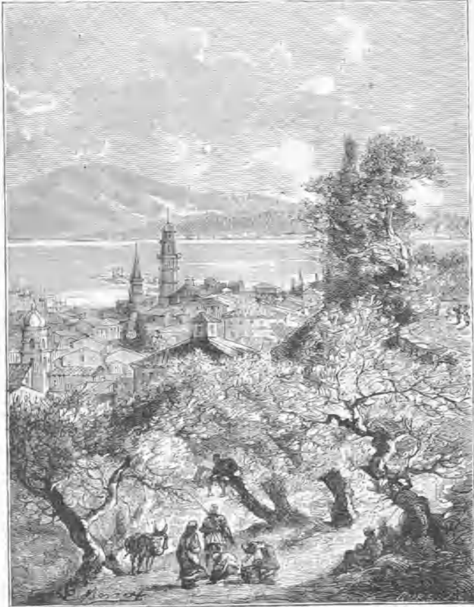
Vista de Zanto.