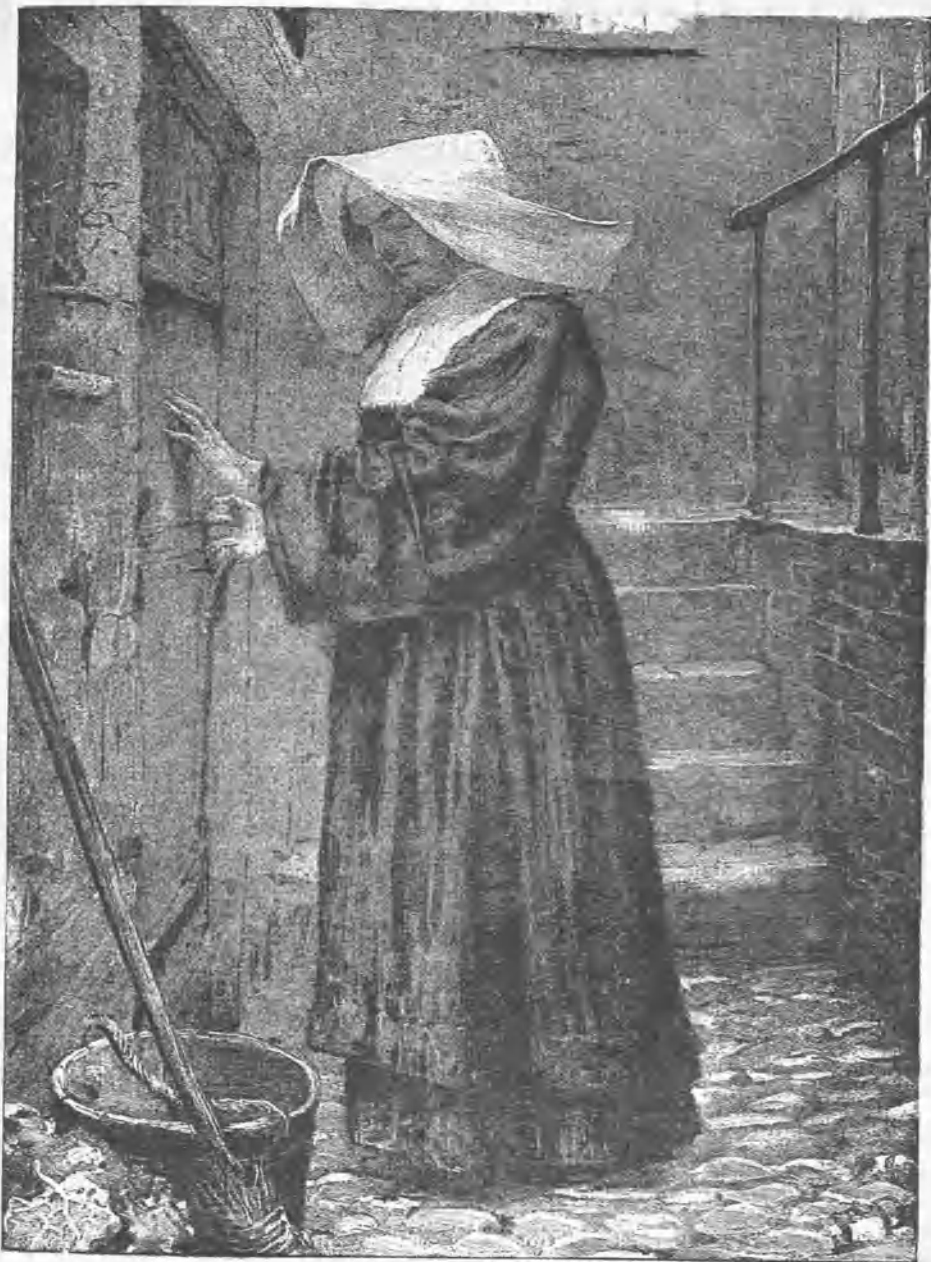
Así vivió muchos años como hermano de la caridad.

bulliciosos campamentos y en los campos de batalla; tan pronto en solitarias aldeas como en populosas villas y ciudades.