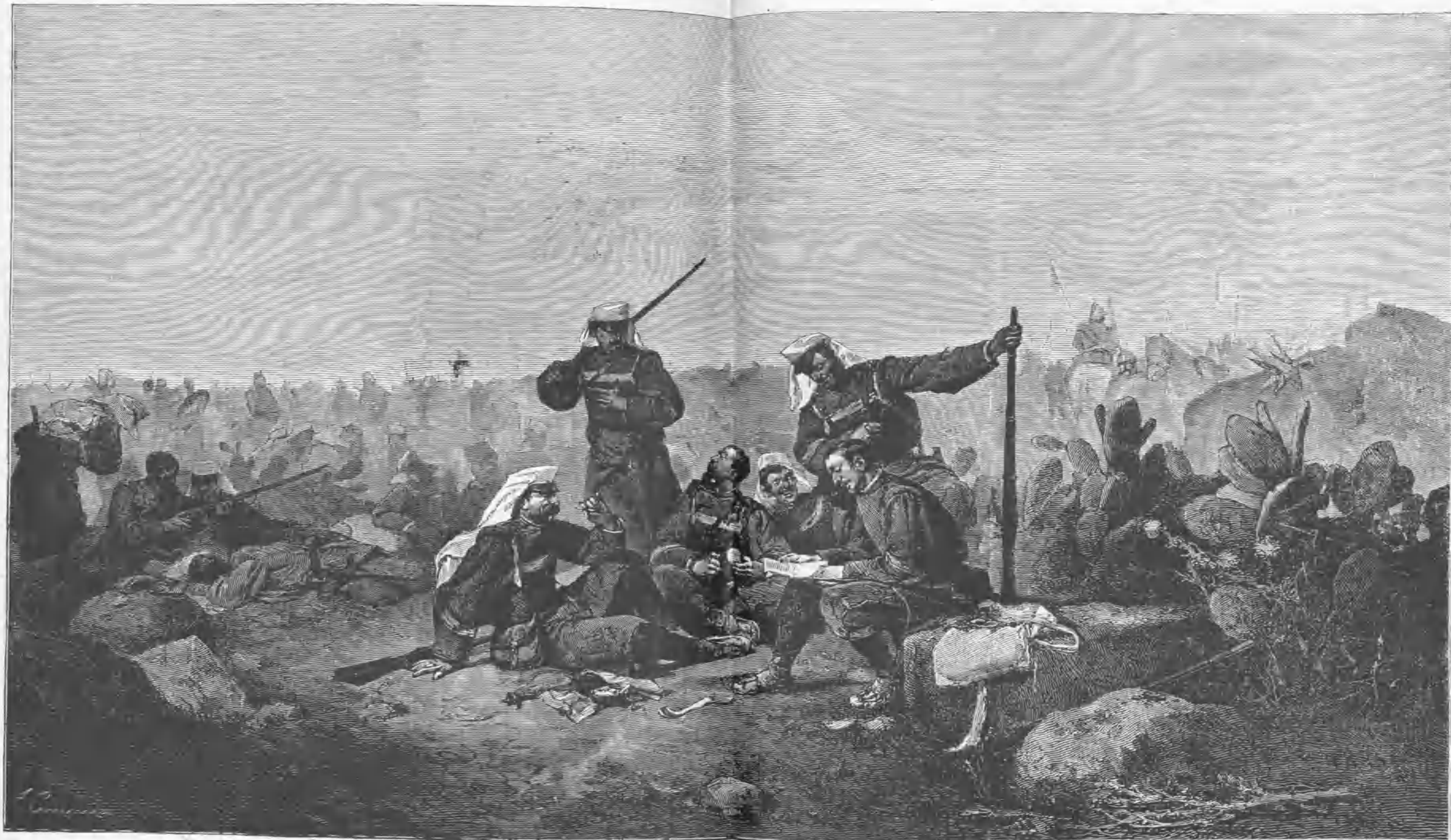
EL DESCANSO EN LA MARCHA.