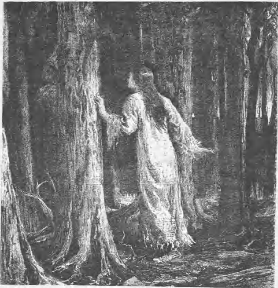
¡Cuántas veces tus ojos habrán contemplado estas arboledas que me rodean

jas todas se dirigen hácia el Norte, con tanta exactitud como el iman: es la flor de la brújula, que el dedo de Dios ha colocado aquí sobre su frágil tallo para dirigir el rumbo del viajero por la ilimitada extensión sin caminos del desierto. Tal es la fe en el alma humana. Los ramos de la pasión de alegras y