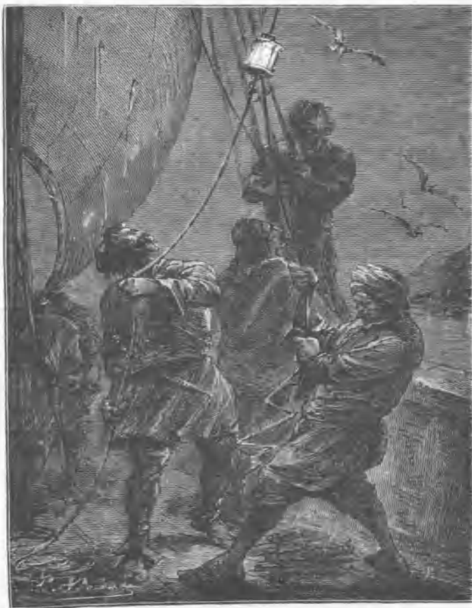
Fue izado un farol rojo.

— ¿ No habeis recalado en ninguna parte desde que salisteis de Trípoli? — preguntó Skopelo.