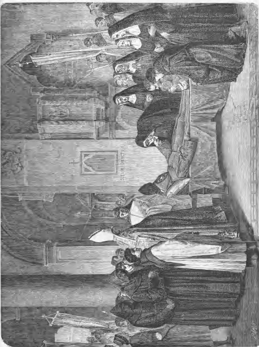
TRASLACION DEL CUERPO DE SAN FRANCISCO DE ASIS.—(CUADRO DEL SEÑOR MERCADÉ.)