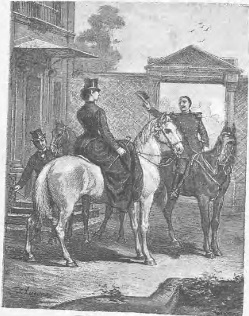
¡Buenos días, caballero!

vencida como su hijo de la inconveniencia de su bella vecina. Sin embargo, las cosas tomaban después de todo un sesgo tranquilizador; la situación se despejaba, y la anciana señora pudo volver á encontrar á la noche siguiente el sueño que había casi perdido desde la brusca llegada de su hijo; por lo tanto le vió