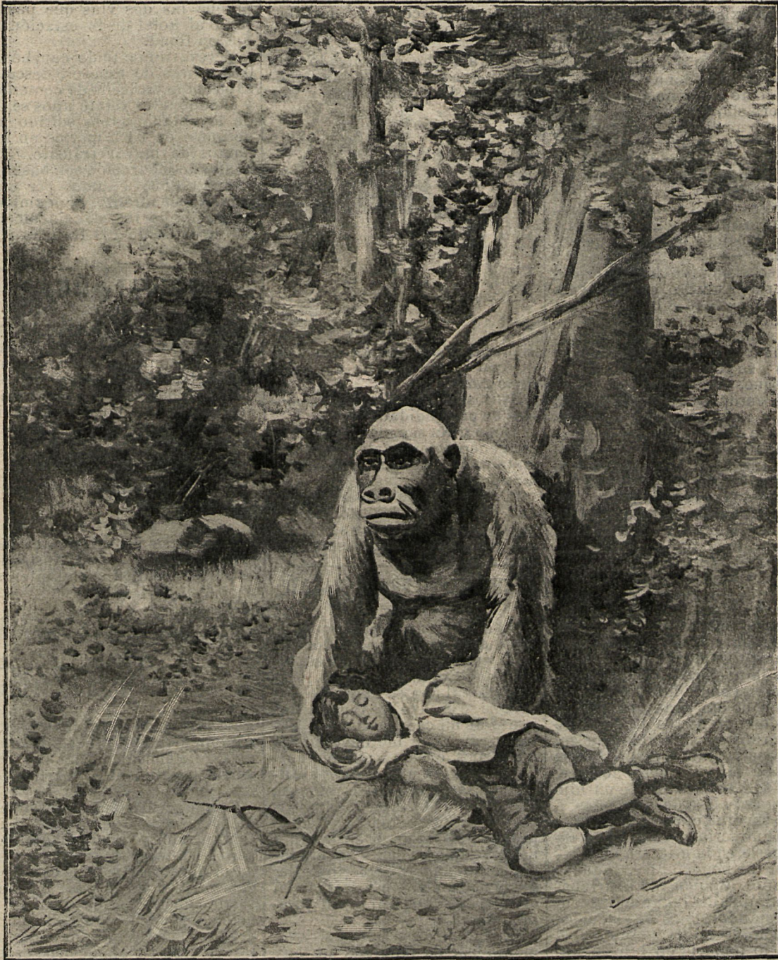
El gorila, depositando cuidadosamente al niño en tierra, lanzó un grito siniestro.