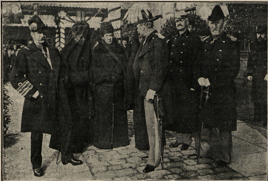
El Rey de Grecia, la Reina de Dinamarca, la Reina de Inglaterra, el Rey Federico VIII de Dinamarca y el Duque de Dumberland en los funerales