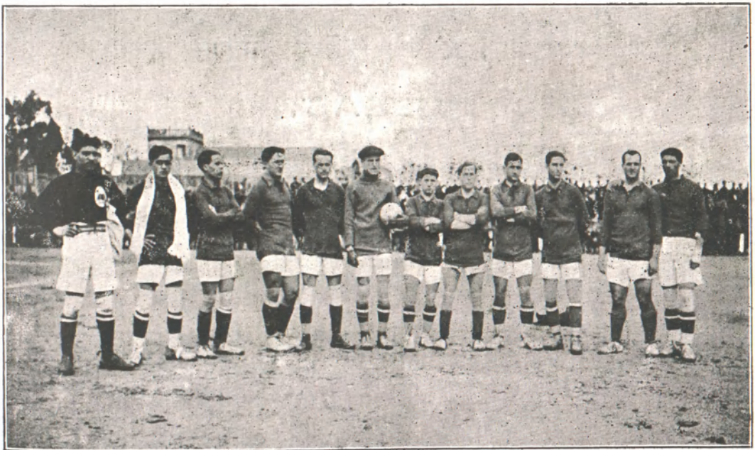
Equipo del «F. C. España» campeón de Cataluña