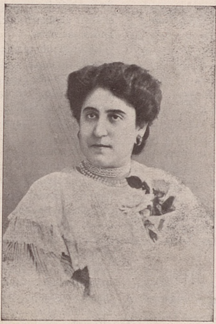
Sustituyó en el papel de Tula á la Srta. Sampedro.