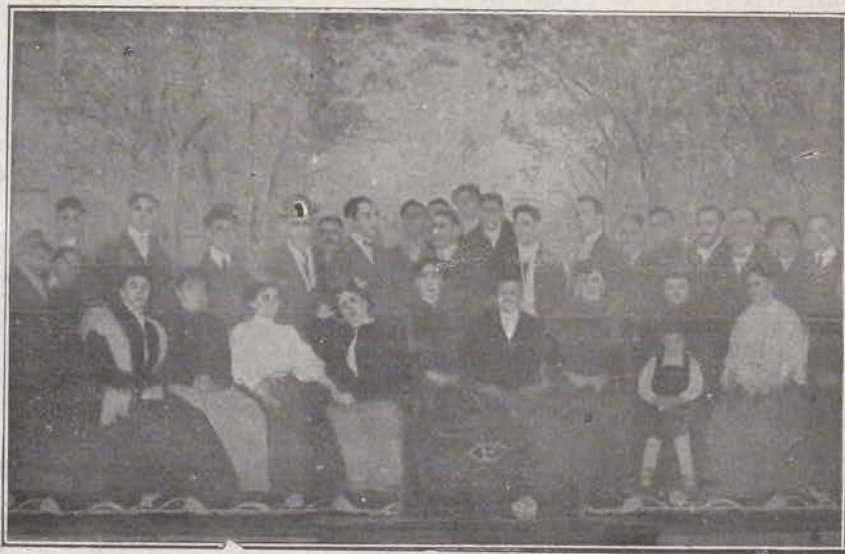
Compañía que actúa en el Coliseo de la Flor.

Un Coliseo más á la larga serie para los autores de firma. Allí estreñerarán Perrín, Picón, Ramos, Martín Ramos Carrión, Sellés, Granés, Chapí, Galdós, Vi-