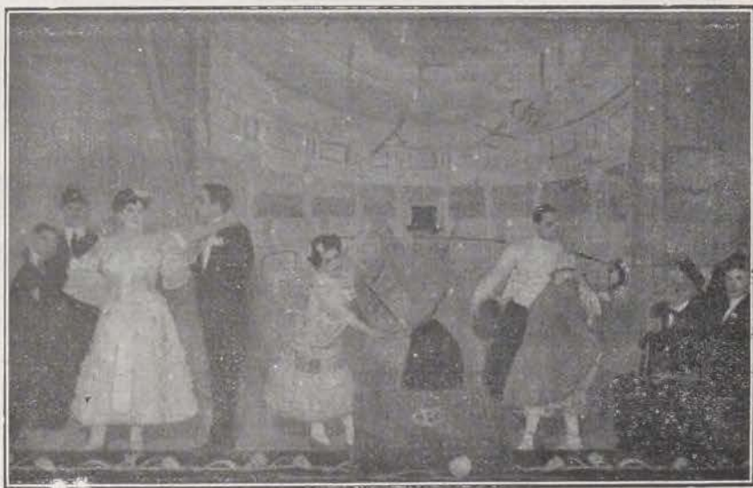
Coliseo de la Flor. -- Una escena de «Ruinas de Talía».

bailable y fusilable, y nos lo han servido bajo el título de «Las Ruinas de Talía». El Coliseo de la flor se