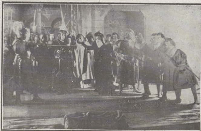
Una escena de «Gerineldo».

parte. El público que acude á retratarse de noche al local donde está instalada la fotografía, el que ocupó el Credit Lyonnais, es tan numeroso, que es imposi-