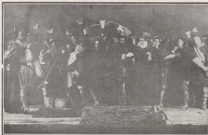
Una escena de «Gerineldo».

ble dar cumplimiento á todos los encargos. El señor Mendoza ha resuelto un problema; ha traído á la cor-