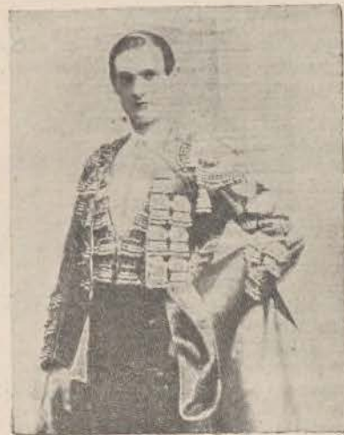
RICARDO TORRES (BOMBITA)