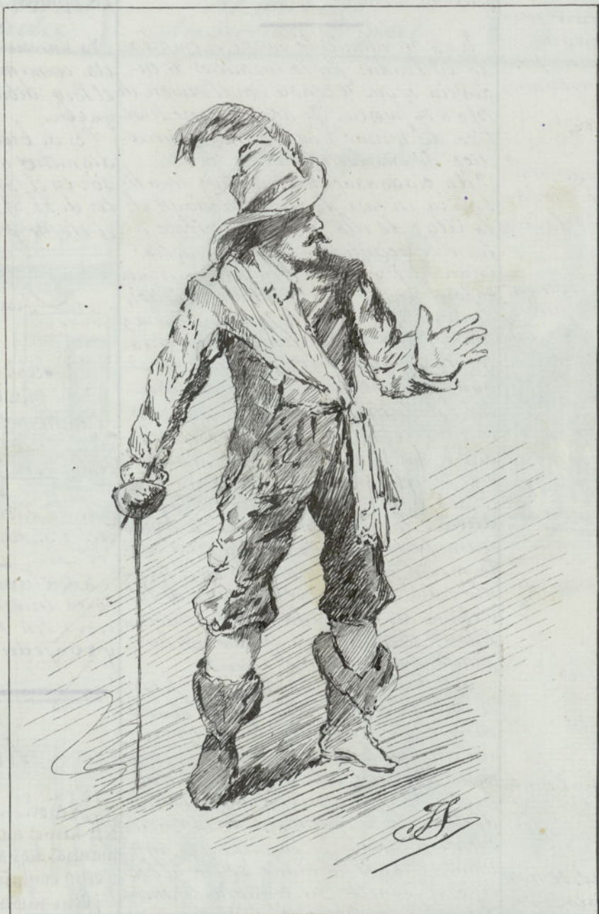
¡Se batío' en Flandes!

Secimor esto porque acercándose la fiesta de todos los santos y la conmemoracion de los difuntos, se de ritará en todos los barrios de la capital se representa el popular drama del eminente poeta Sr. Quintanilla y así vemos que desde el Español hasta el último café-cabaret, todo absolutamente todo, están ensayando dicho drama creyendo es decir que la concurrencia en todos los teatros será numerosa.