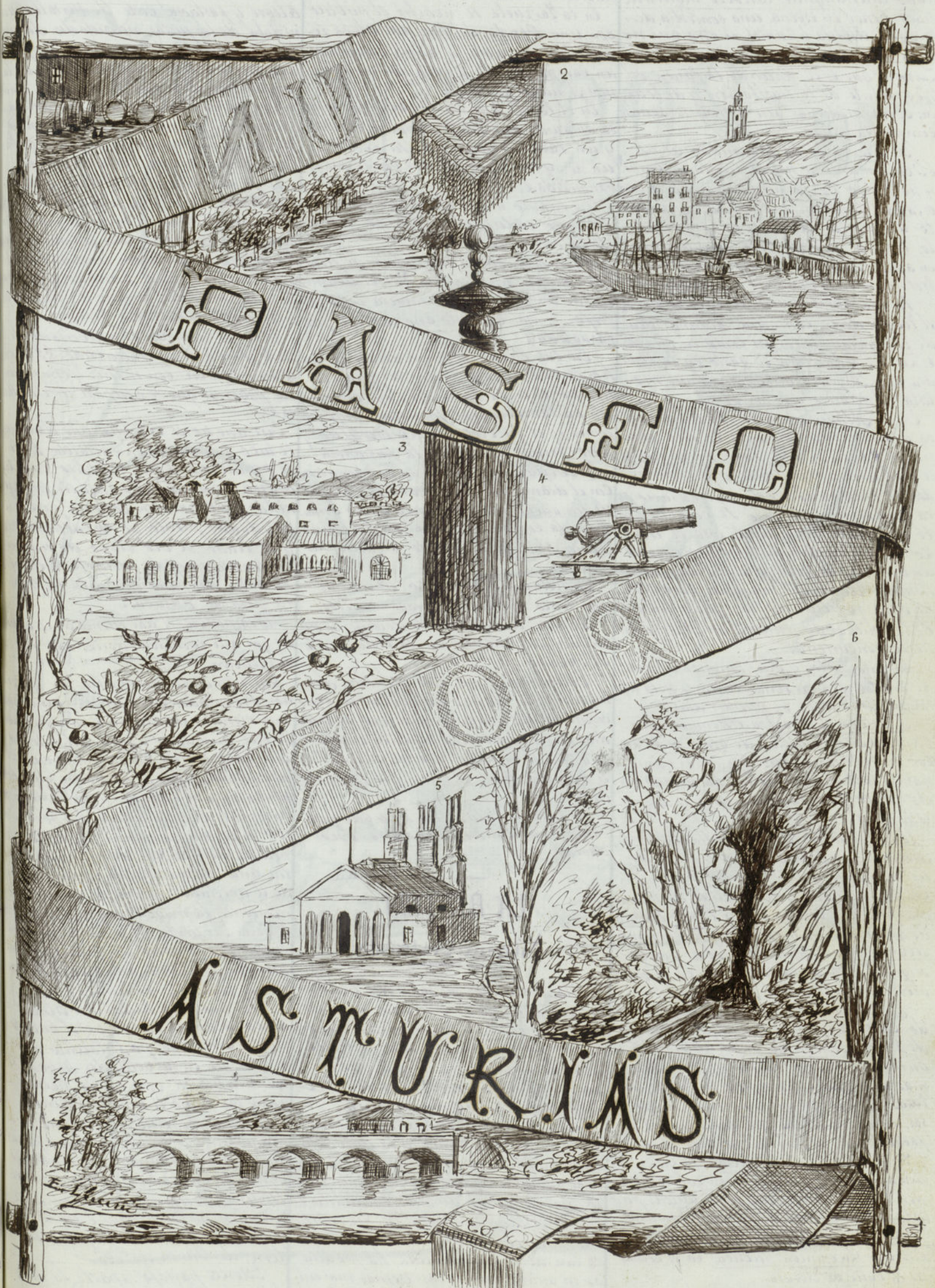
1-Paseo de Begoña - 2-Entrada y Faro del puerto de Gijón - 3-Altos hornos de la fábrica de cañones de Trubia - 4-Obús de 21 ca - 5-Taller donde se funden los cañones - 6-Peñas de Caranga - 7-Puente llamado de Soto, sobre el Nalon en la Carretera de Oviedo á Grado.