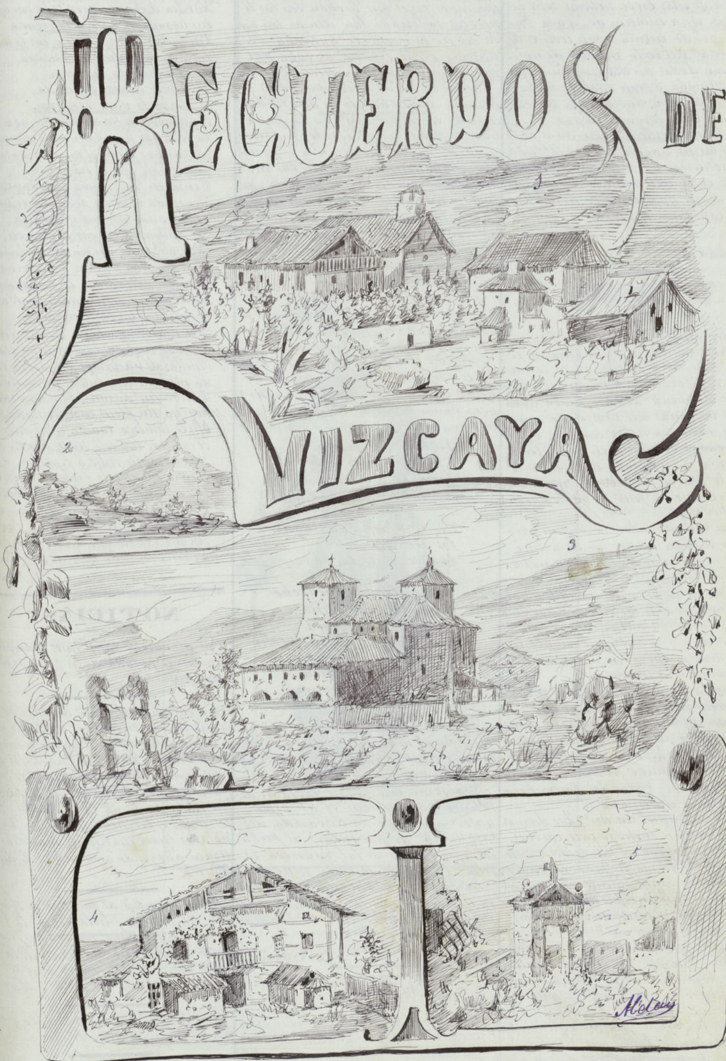
1.- Oquendo: Banio de Villachica. 2.- Bilbao: Pico de Eresa. 3.- Iglesia de Oquendo. 4.- Un caserío. 5.- Restos del Cementerio de Albia (Bilbao) después del bombardeo.