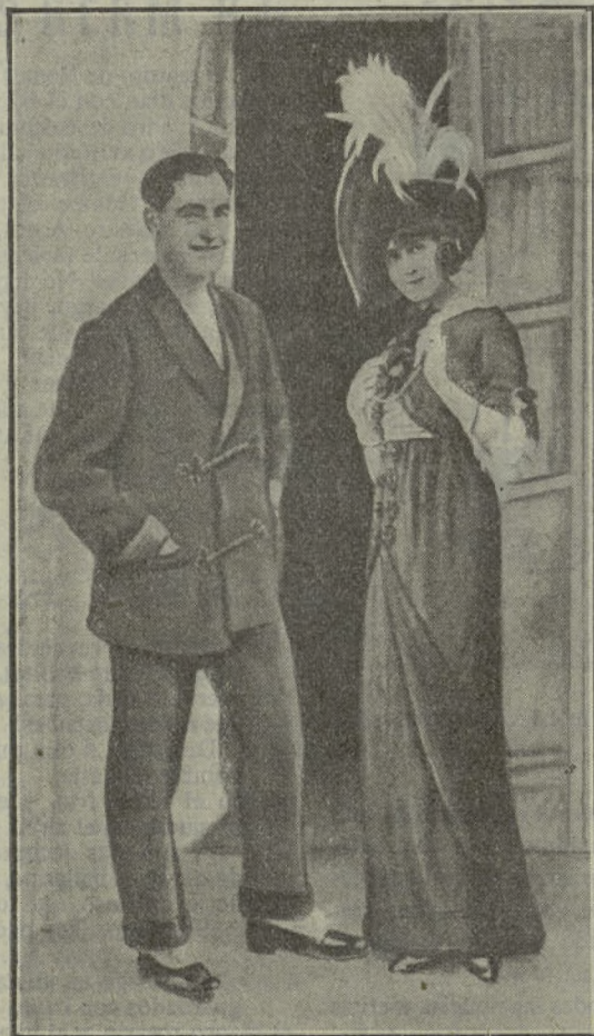
« LOS DOS »