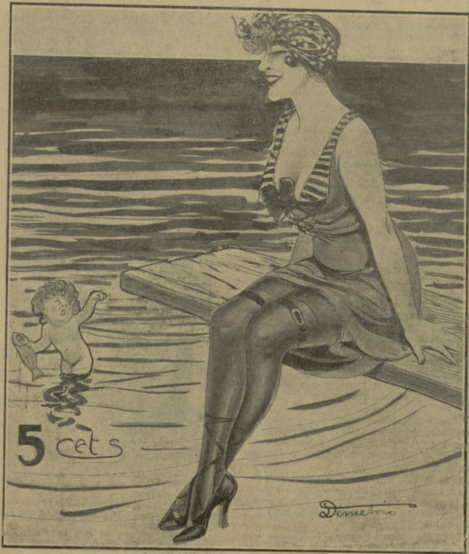
El amorcillo.—¡Coqueta, baja; que te he encontrado un marido a propósito!

Se publica los domingos Año I :: Número 5