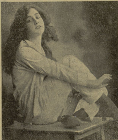
Traje de dormir. Algunas lo llevan puesto casi todo el día. ¡Es tan cómodo!...