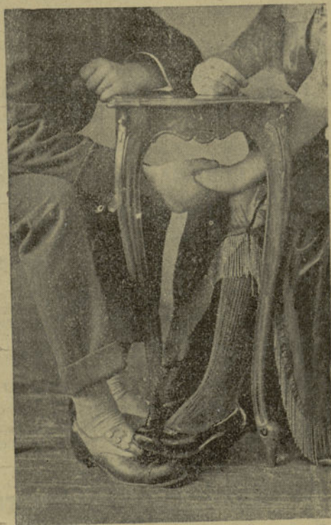
Una mesita muy pequeña, que, con un poco de buena voluntad, permite todas las aproximaciones.