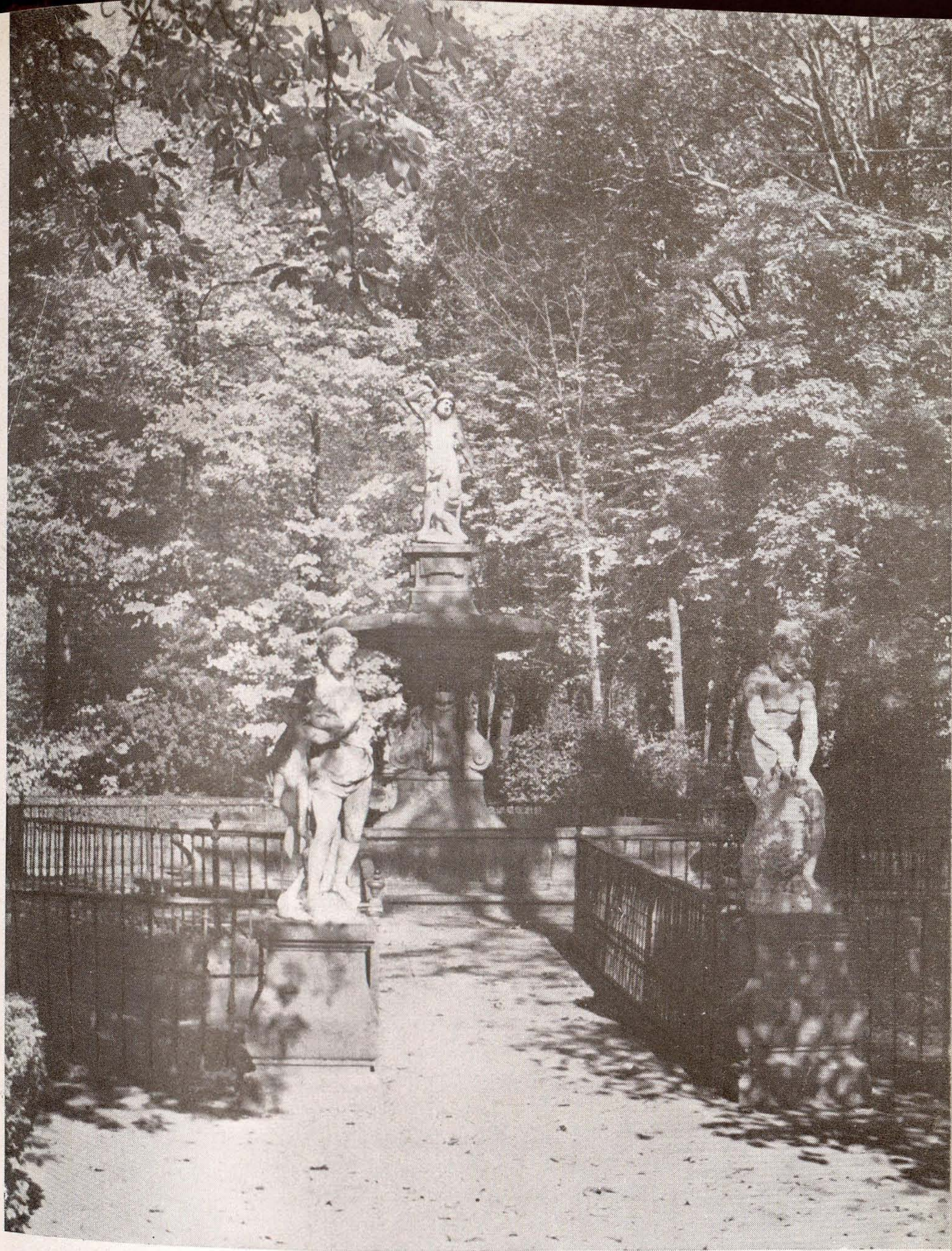
JARDINES DE ARANJUEZ (España)