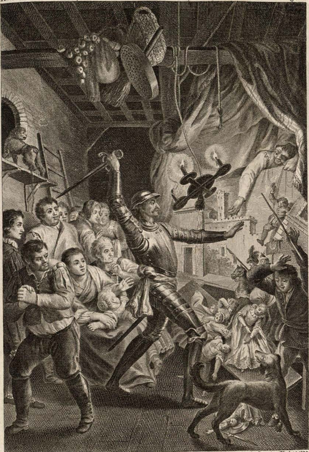
Antonio Carnizero la inv. ta y dibujó