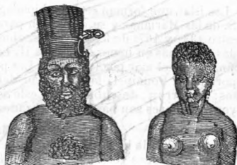
(Hombre y muger de Nueva Zelanda.)

Dase este nombre á dos islas que antes se creeno formaban mas que una. La Nueva Zelanda, situada entre 34° y 47° de latitud S. y entre 164° y 179° de longitud E., fué descubierta por Tasman en 1642, el cual observó hallarse dividida en dos grandes islas por un estrecho, al cual dió su nombre. Atraviésalas en toda su largura una cadena de montañas muy altas. La isla del N., Icama-mawvi ( Tasmania del N. ), fértil y bastante poblada, tiene 180 de largo: la del S., Tavai-Pounamniu ( Tasmama del S. ) es montuosa, árida y poco habitada. Su temperatura viene á ser como la de Francia, que casi es antípoda de la Nueva Zelanda.