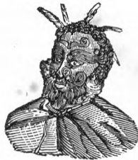
(Hombre de Australia.)

La isla de Hawaii ( Owhyhee de los ingleses), cubierta de montañas volcánicas, encierra el monte Mouna-Roa de 16.940 pies de alto, y uno de los puntos mas elevados del globo. En esta isla fué asesinado el desgraciado Cook el 14 de febrero de 1779. Mawi ( Maouvi ), la mayor despues de Hawaii y una de las mas pobladas, se distingue por su aspecto pintoresco. Oahu ( Wohaou ) es la cuarta en estension y la mas importante de todo el Archipiélago desde que en ella se ha establecido el gobierno. Por su belleza y frondosidad es denominada esta isla el jardin de las islas de Hawaii . Cuéntanse en este Archipiélago 130,000 h.