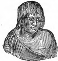
(Muger de Australia.)