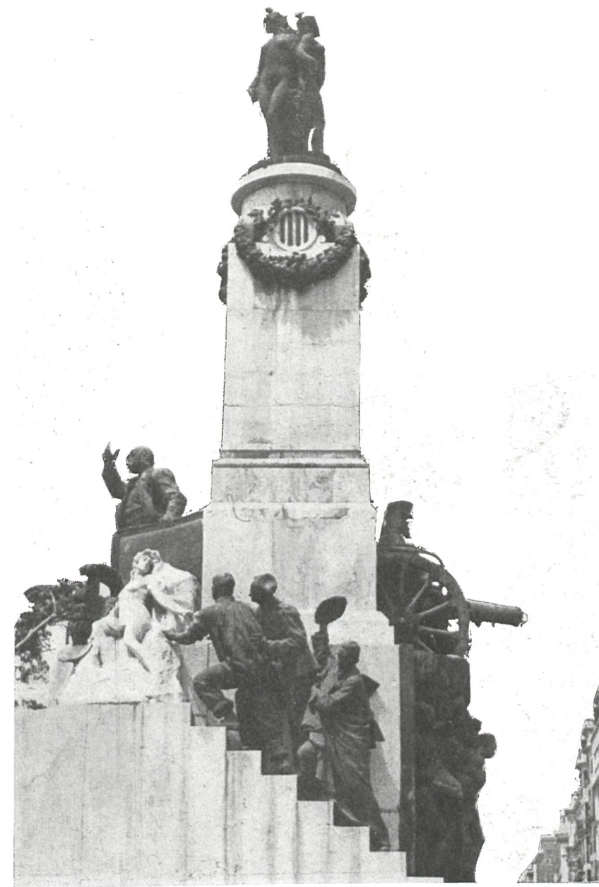
En el Monumento al tribuno y político Castelar, las tres figuras femeninas que representan la Igualdad, la Libertad y la Fraternidad.

NO son muchas las damas, las damiselas es la verdad, que tienen en Madrid estatua. Muchas más son, eso sí que es cierto las que realmente estatuas parecen; pero no entremos en lo que puede llamarse zona de piropeo y quedémonos entre la historia y la anécdota.