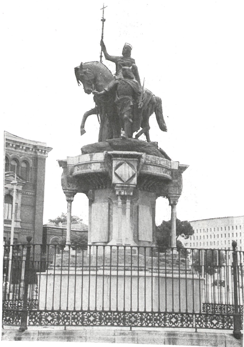
Monumento a la Reina Isabel la Católica, la gran creadora de la Unidad española.