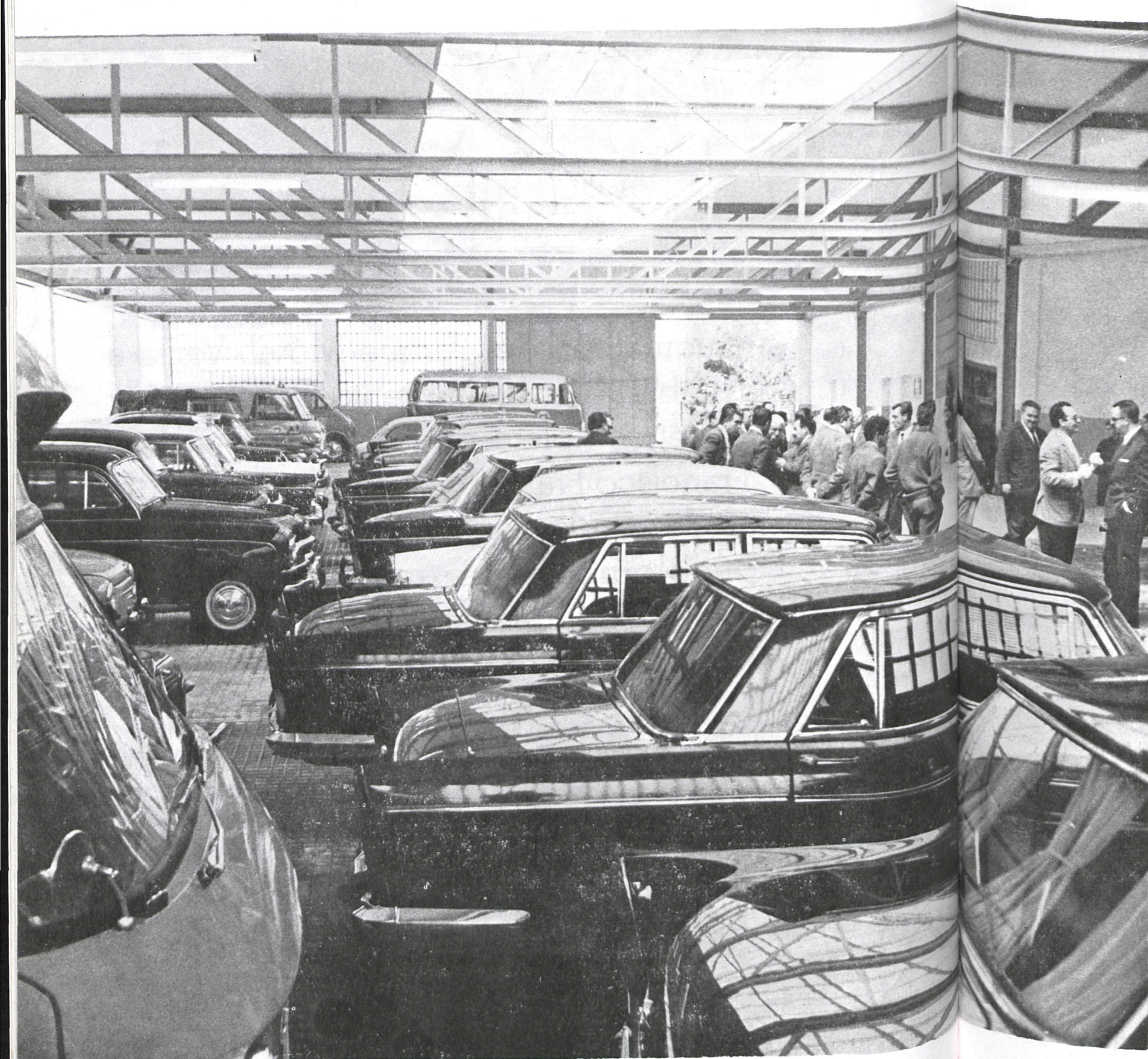
la nave central del nuevo Provincial el día de su inau-