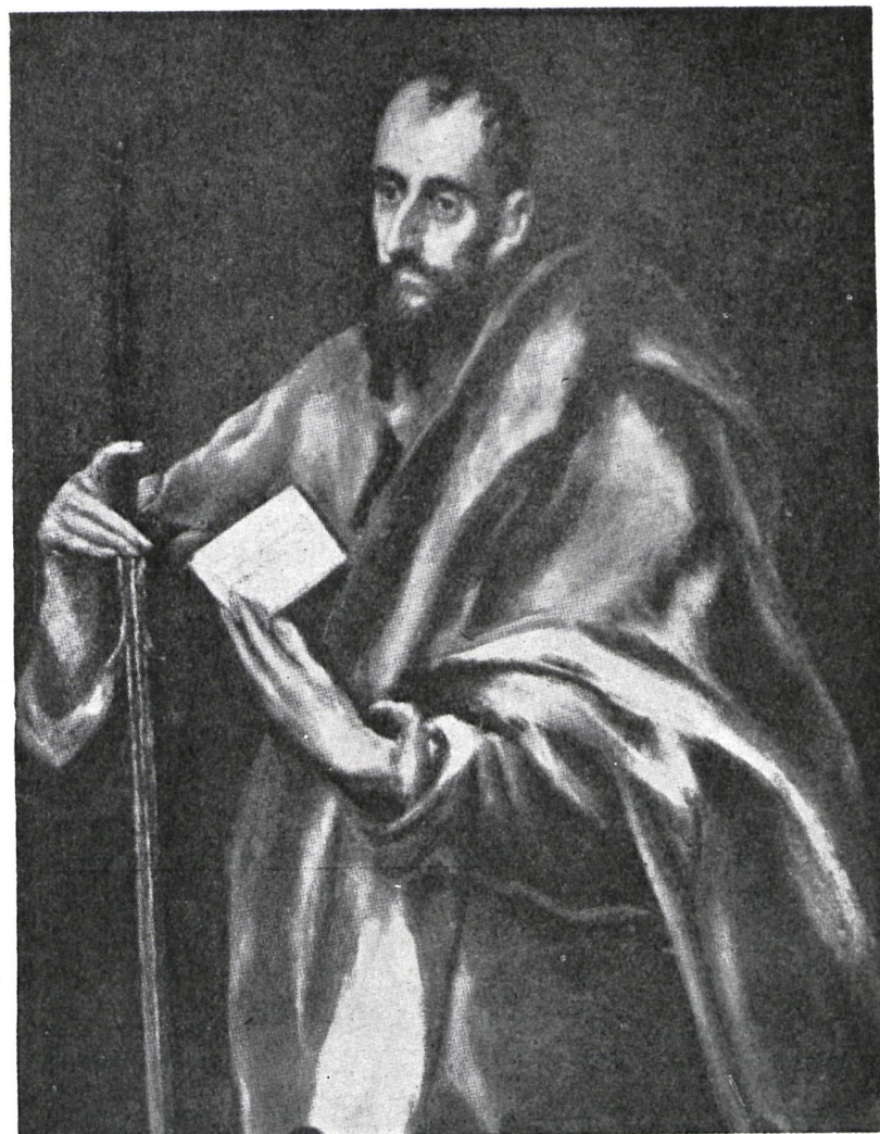
SAN PABLO, CUADRO QUE FIGURA EN EL MUSEO DEL GRECO, DE TOLEDO, Y SAN PEDRO, OBRA TAMBIEN DEL GRECO, QUE SE ENCUENTRA EN LA SACRISTIA MAYOR DE LA CATEDRAL DE TOLEDO.