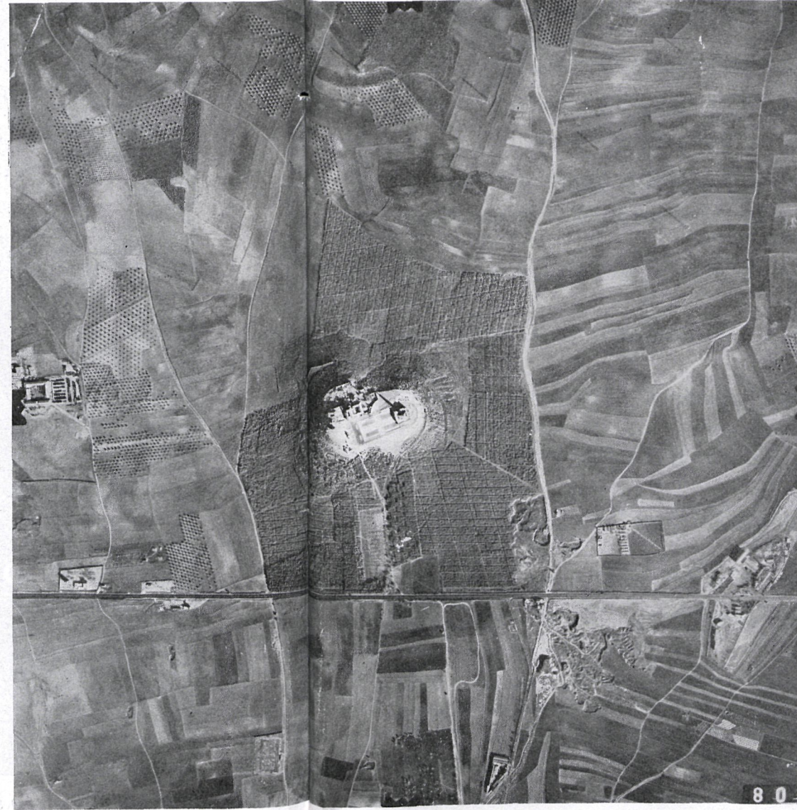
Replantación forestal del Cerro de los Angeles.

Afectan a los 22 términos municipales que integran el Area Metropolitana de Madrid.