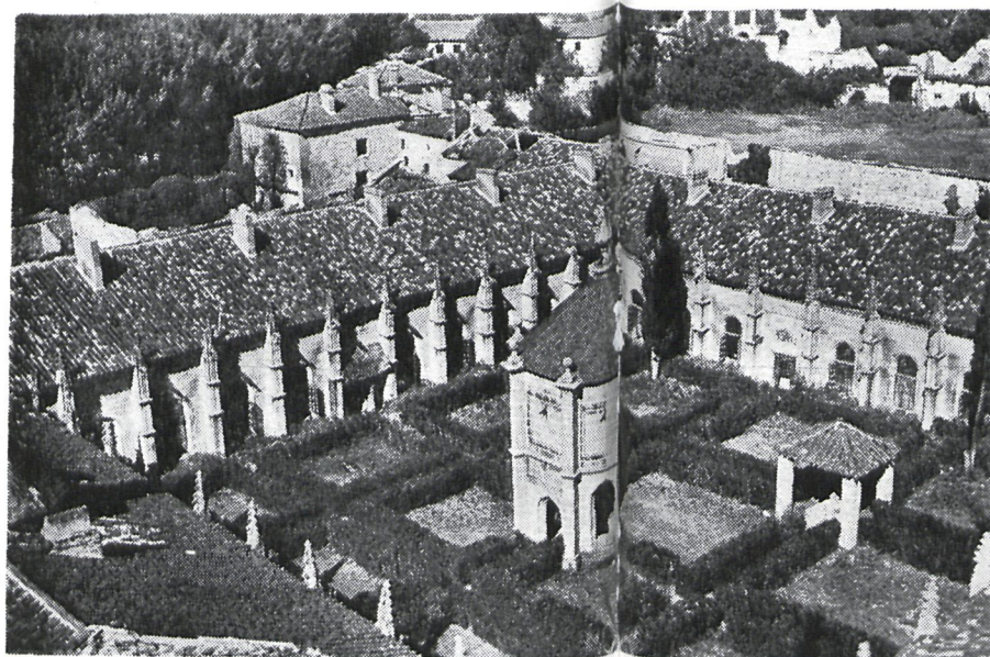
Dos aspectos del monasterio El Paular y uno de sus retablos