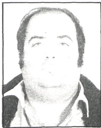
El policía «ful»

• Dos policías nacionales de paisano han sido noticia: uno de ellos fue asaltado, de madrugada, por ocho individuos en la Gran Vía madrileña cuando se disponían a tomar un taxi. Gracias a que utilizó su arma reglamentaria y a la inmediata actuación de un coche patrulla, se evitó el atraco y se detuvo a tres de los asaltantes.