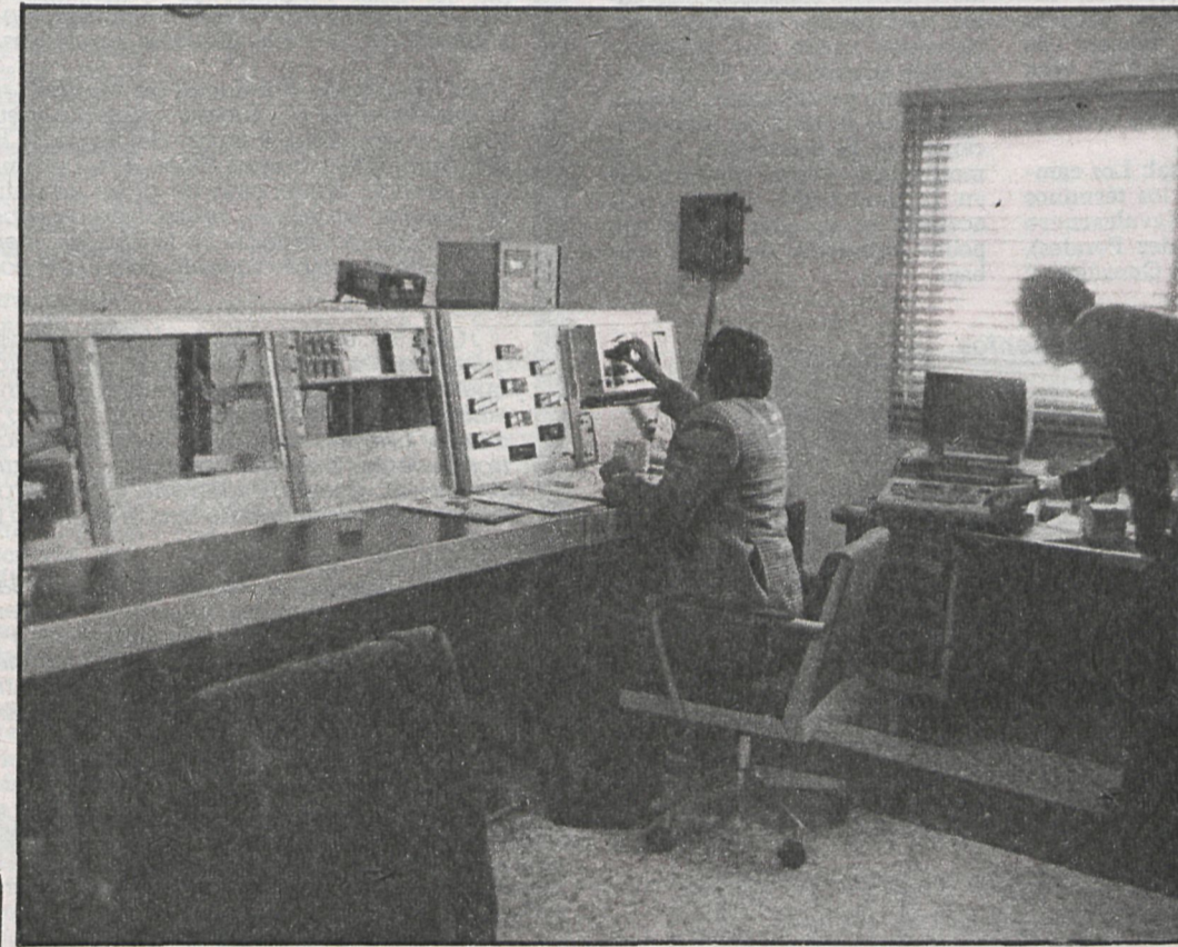
Paneles situados cerca de las planchas productoras de energía solar controlan las posibles alteraciones de calor

diversificación más de su competencia. Hasta los industriales aeroespaciales (Boeing, McDonnell Douglas y Martin Marietta) han demostrado un no desinteresado interés por las grandes plantas de energía solar.