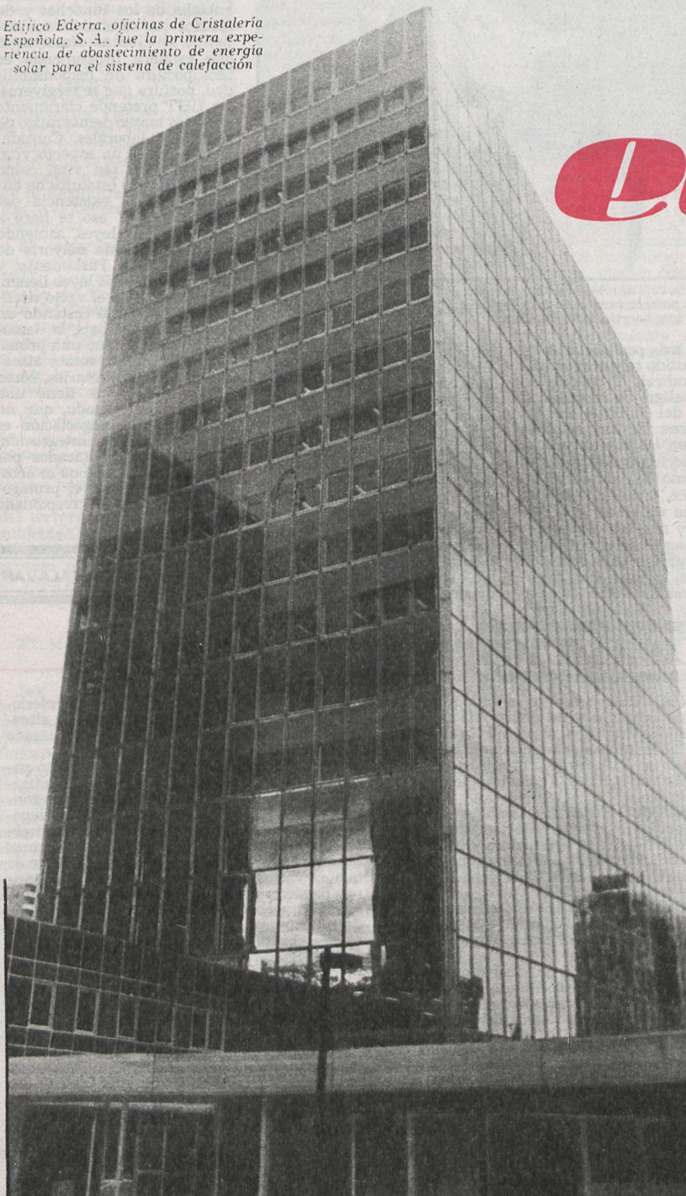
Edificio Ederra, oficinas de Cristalería Española, S. A. fue la primera experiencia de abastecimiento de energía solar para el sistema de calefacción

Escribe: Maite Contreras