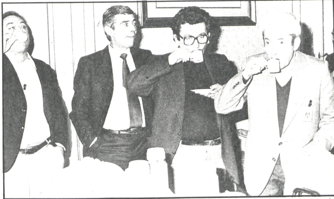
Eran los tiempos de los «pactos sociales» y se tomaba café antes de que las centrales y el Gobierno se sentaran a la mesa de negociaciones en Castellana, 3. Aunque parezca mentira, ya es historia. Pero la historia, para poder contarla, hay que hacerla todos los días

se va a plantear en los centros de trabajo cuando los afiliados de CC. OO. reprochen a los de UGT la firma del acuerdo y del Estatuto. ¿Cuál va a ser la defensa de UGT en este sentido?