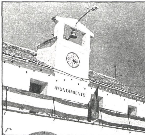
Fiesta «de la otra» en el Ayuntamiento de Parla