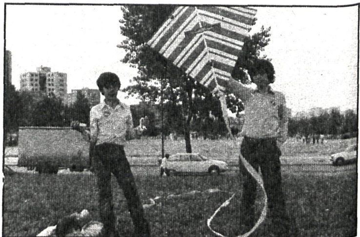
Cultura y juego. El niño, protagonista

Los dos últimos días, 22 y 23, estuvieron dedicados a teatro y concursos y fiestas infantiles. Hubo un concurso de pintura y una fiesta de clausura en el polideportivo de Leganés con la actuación de Santi el Mago , marionetas, los payasos Listón y Tolón y Elenita y sus muñecos . Todo ello con el colofón de la Banda Municipal de Música .