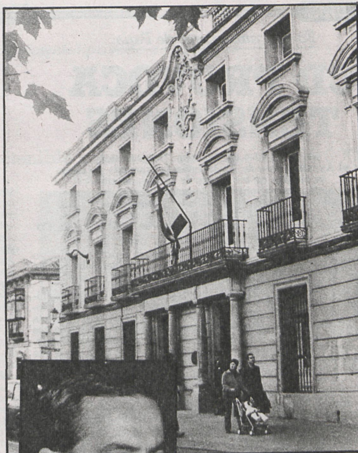
La bandera lució a media asta en el Ayuntamiento de Alcalá

Al día siguiente, sábado 15, la Sala de Plenos del Ayuntamiento se encontraba abarrotada de vecinos y estudiantes. Pasadas las trece horas el alcalde abrió el pleno pidiendo un minuto de silencio. Seguidamente leyó el único punto del orden del día propuesto por los partidos de izquierda, que trataba, básicamente, de los sucesos del día 13 y las acusaciones hechas por el gobernador al alcalde, que, en cierta for-