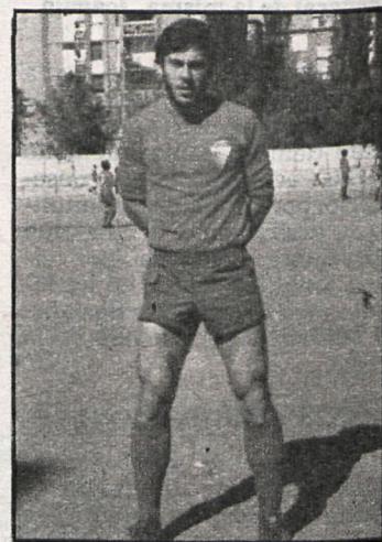
Capitán del Aranjuez, encabeza la clasificación en Tercera División