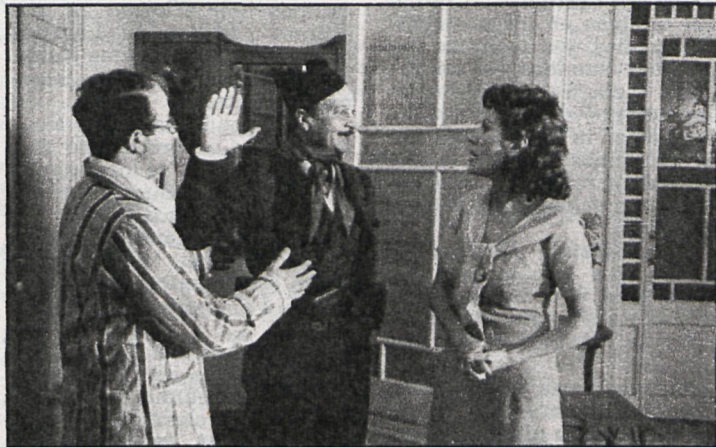
«Las largas vacaciones del 36», de Jaime Camino, en el FSM

Meta importante que se han impuesto los organizadores del invento cultural es conseguir que el cine-club no acabe en la simple proyección de la película y que se parezca, como tantos otros, a salas cinematográficas comerciales, donde pagas la entrada, ves la película y, una vez acabada, a la calle. Para que esto no ocurra, en los ciclos de películas españolas se invitará al realizador y algún miembro del equipo técnico-artístico del filme para que presenten su película y se sometan posteriormente a una rueda de preguntas procedentes de los socios del cine-club; cuando los ciclos se