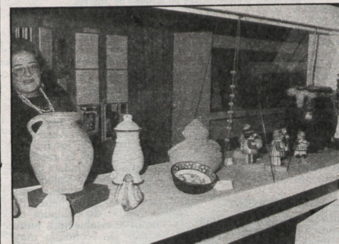
Objetos de barro y cerámica atraen la atención de los visitantes

Un apartado de la exposición de gran importancia para conocer el pasado de la provincia y su desarrollo aparecía en vitrinas dedicadas a instrumentos utilizados para tareas de la