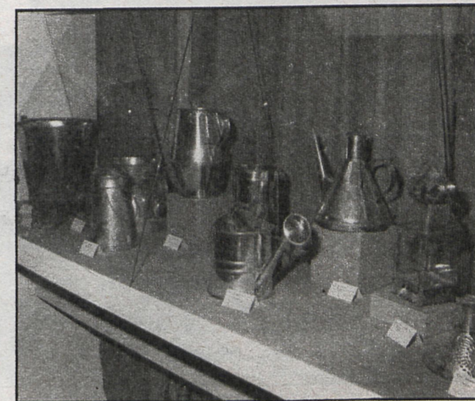
Materiales de latón en la línea de la tradición artesanal madrileña. Objetos tan autóctonos como la regadera, el farol o las cántaras tienen un encanto especial trabajados con estos materiales

Trajes típicos, alfarería y latón, lo más atractivo de la muestra que se simultaneó con las Jornadas