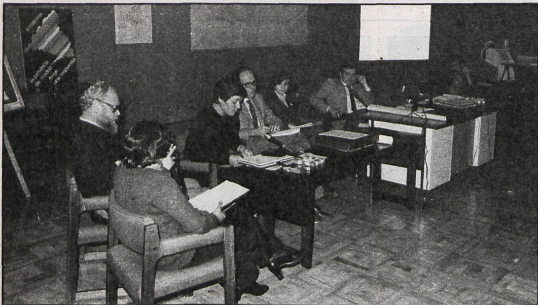
La Ciudad Escolar Provincial acogió a los ponentes y profesionales de las distintas disciplinas, que enviaron un auténtico torrente de materiales para el mejor desarrollo de estas II Jornadas

Los análisis realizados en las Jornadas se centran en las transformaciones de la vida tradicional como factores sustentadores de una identidad cultural a diversos niveles, a partir de la heterogeneidad característica de la provincia