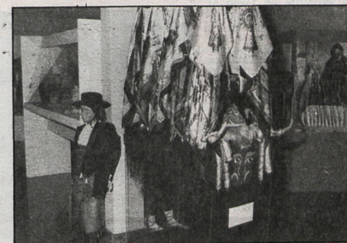
Traje típico campero y pañuelos con motivos vistosos y a todo color

interés. Los pañuelos tenían una presencia especialmente particular por su colorido y el papel que siempre ha jugado esta prenda en la indumentaria de los madrileños y madrileñas.