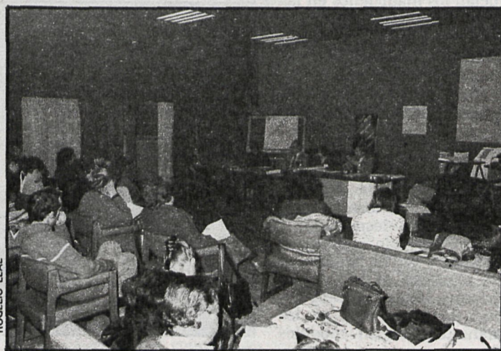
Las sesiones de las Jornadas estuvieron muy concurridas de estudiosos, sociólogos y especialistas en el tema de Madrid