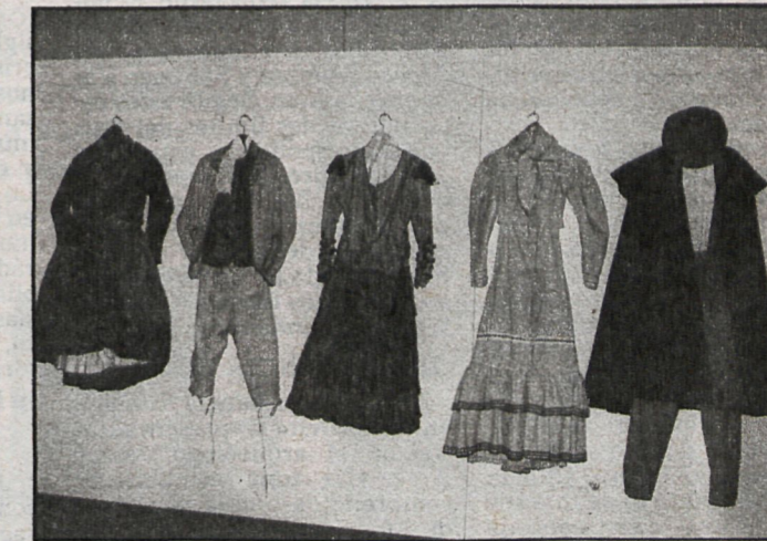
Trajes típicos de la capital y provincia de Madrid, colgados de sus perchas, como retazos de vida que fue, a veces gloriosa, a veces trágica. Así era Madrid

branza, usuales en la provincia de Madrid. Y el renacimiento de la alfarería y los trabajos en latón se hacía patente en la muestra, con vitrinas dedicadas a Camporreal y a los artesanos madrileños que han sabido mantener el arte del trabajo en latón. Lo importante de esta exposición era su actualidad, su viveza, desde el momento en que los madrileños vuelven la cabeza a su pasado para urgar en las manifestaciones culturales madrileñas. Pero, afortunadamente, no todo se queda en la vitrina, sino que la utilización de los productos artesanos tradicionales se hace cada día más intensa en las viviendas, mucho más frías y despersonalizadas que las de nuestros antepasados.