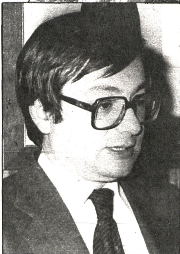
Javier Tusell, director general de Bellas Artes

Para que un monumento sea restaurado, el primer paso es recibir la propuesta de la Delegación Provincial; de ahí se pasa al estudio de aquélla por parte de los servicios técnicos, que, de aprobarla, encargan, el proyecto a un arquitecto. A veces también interviene la Jun-