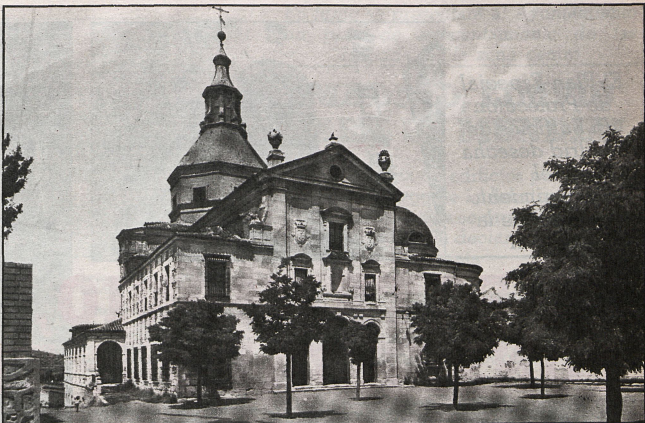
La iglesia renacentista de Torrelaguna, en la plaza de la Villa madrileña

De tres naves, muros de mampostería con cadenas de sillares; pilares toscados, arcos rebajados, nave central cubierta con bóveda de cañón moderna y laterales de aristas; en el crucero y brazos, crucería de tercelentes y combados; el coro, en alto, a los pies. La torre, del XVI y XVII, a los pies de la nave del Evangelio, de cuatro cuerpos, mampostería,