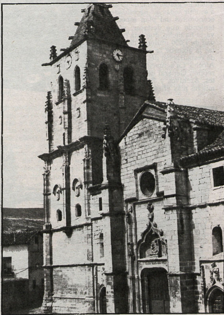
El convento de dominicas de Loeches

ladrillo y cadenas de sillares. En el presbiterio retablo de San Pedro, siglo XVII, con columnas corintias: «Martirio de San Pedro», de Rizi, y pinturas muy necesitadas de ser restauradas. Hace una semana que visitamos este monumento y pudimos conocer «in situ» lo necesitada que está de consolidar los grandes bloques de piedra que componen sus ventanas, algunos de ellos ya desprendidos y otros a punto de caer. La Diputación encomendó a un arquitecto del Patrimonio Artístico realizase un anteproyecto y es posible que de ello venga el incoar expediente. Confiamos que entre el Ministerio de Cultura y la Diputación no se pierda tan dignísima obra arquitectónica, de la que la provincia de Madrid debe sentirse orgullosa.