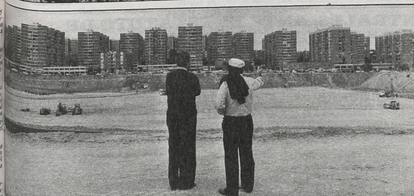
Los vecinos ante unos hechos consumados se limitan a ser espectadores pasivos mientras se llevan a cabo las obras