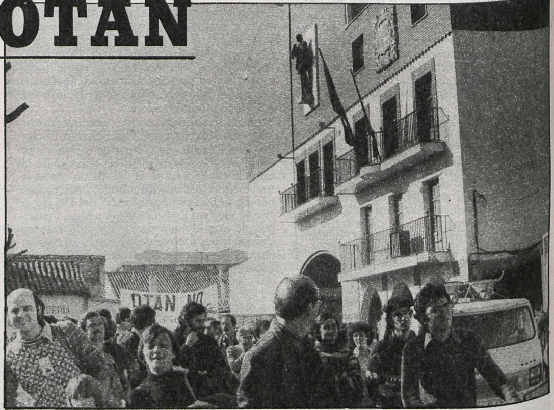
Ya el año pasado, los vecinos de Torrejón mostraron su oposición a la OTAN

«El grupo socialista de la Corporación de Aranjuez ante