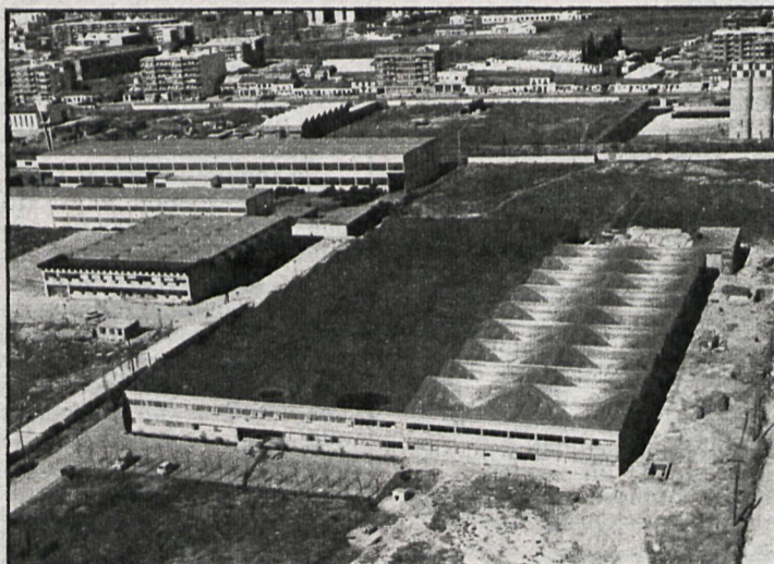
Gran parte de las industrias están empezando a salir del túnel de la crisis

Junto con el ANE, la obligación contraída por el Estado de reformar la Seguridad Social ha sido otro de los temas esen-