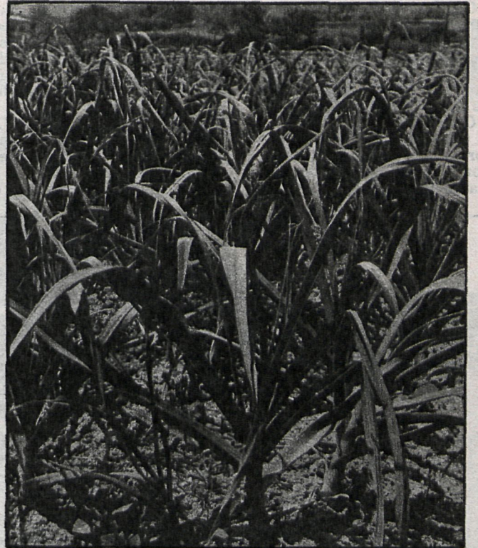
Los agricultores quieren asegurar sus cosechas ante cualquier eventualidad

Estos resultados son esperanzadores pensando en las próximas campañas y siendo deseable una mayor participación de los agricultores en esta modalidad. Es de señalar que las pólizas colectivas las puede contratar cualquier entidad legalmente reconocida, yendo el espectro desde las Cámaras Agrarias, Diputación, etc., hasta las propias organizaciones del sector.