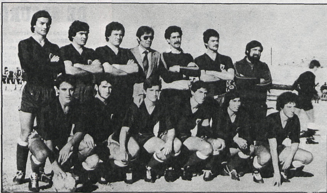
Los hombres del Parla saldrán a por todas en su enfrentamiento con el Ciempozuelos

También en esta jornada la atención y la expectación se encuentra centrada en este encuentro entre dos magníficos equipos de la provincia. Los locales, que en la anterior jornada vencieron al Avila, han consolidado de esta forma su puesto de líderes, mientras que los visitantes negriazules del Parla se encuentran en la segunda plaza con un punto menos. El resultado es muy difícil de vaticinar, aunque debe imponerse la lógica, que, en este caso, se inclina a favor del Ciempozuelos. Tomemos a continuación el pulso a los restantes equipos