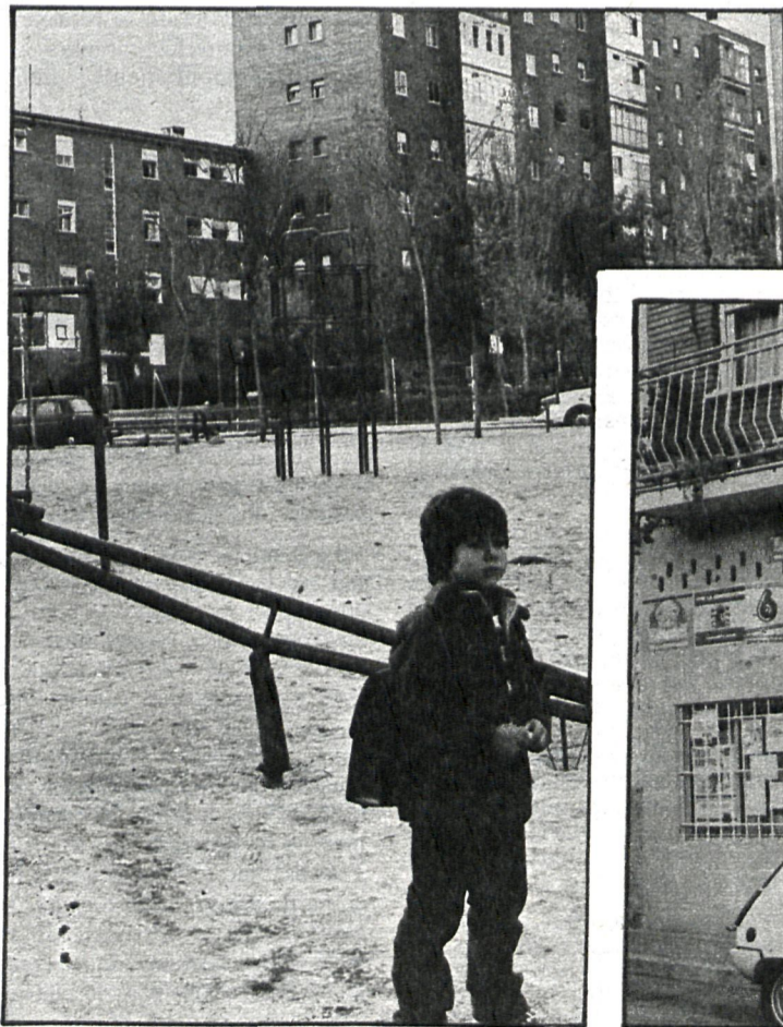
La Asociación de Vecinos del Parque de Opañel ha hecho una gran tarea construyendo parques y manteniéndolos por expreso deseo de sus socios. Ahora han surgido problemas con la Junta de distrito

Pero el tema más conflictivo son las instalaciones deportivas. La asociación se propuso