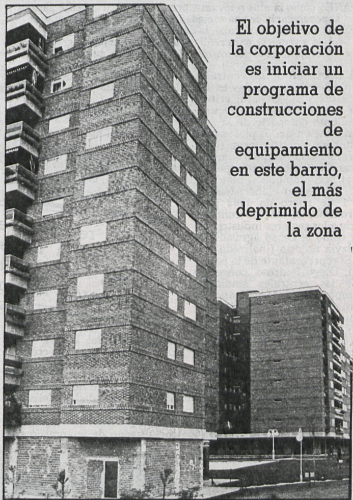
Esto es hoy San José de Valderas: una inmensa mole de cemento y ladrillo, sin los más elementales equipamientos sociales

Para que todos estos proyectos puedan tener eficacia real, es imprescindible que la Junta de Compensación concluya los estudios de detalle y demás instrumentos de la planificación urbanística que prevé el Plan Parcial. Y ahí el Ayuntamiento goza de poca movilidad, porque la iniciativa corresponde a la Junta de Compensación, que tiene que presentar estudios de