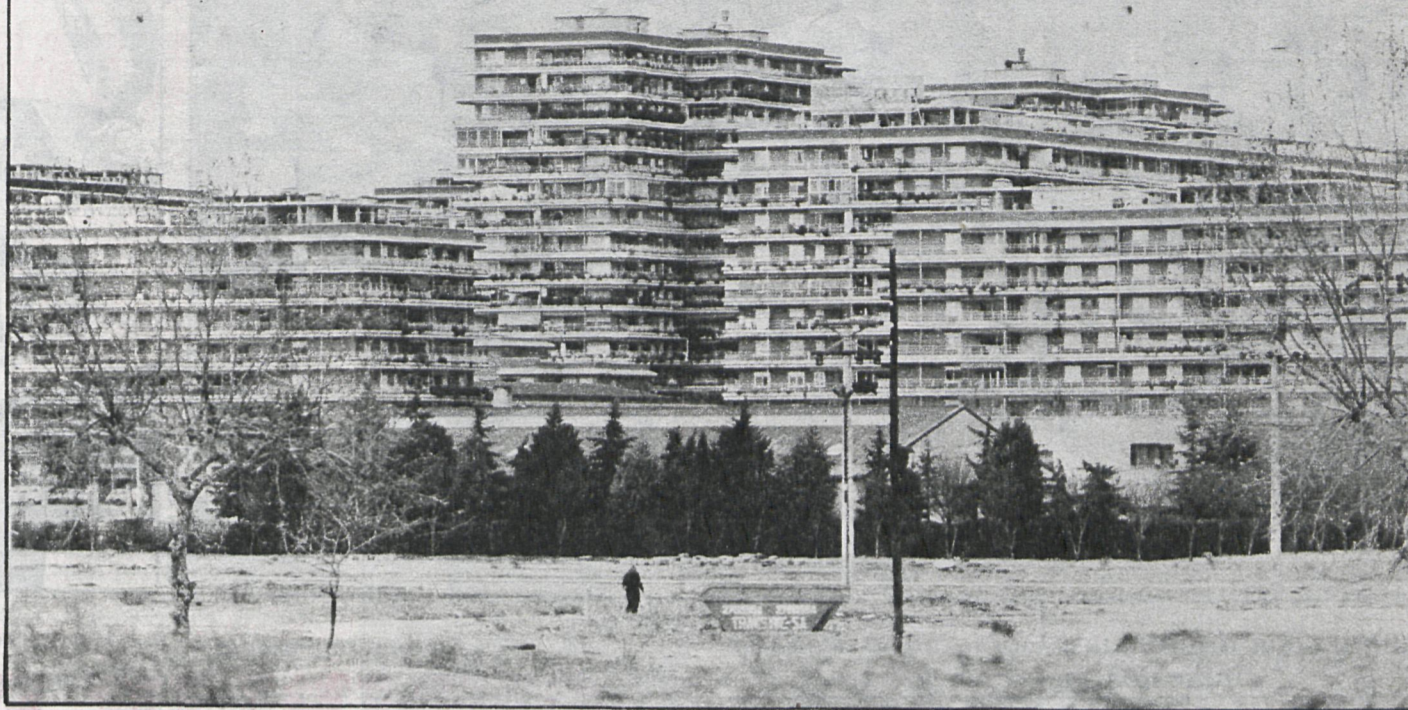
El Ayuntamiento de Alcorcón tiene que enfrentarse al caos urbanístico de San José de Valderas, heredado de anteriores corporaciones