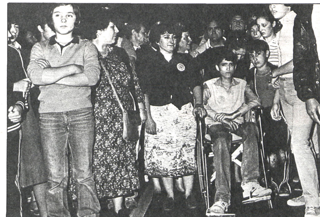
Las acciones de los afectados por el aceite tóxico en Madrid comenzaron con una manifestación de protesta que congregó a miles de madrileños

La Diputación, dispuesta a ofrecer ayuda previa formación de un ente que canalice los caudales, a los que se muestra dispuesto el organismo provincial