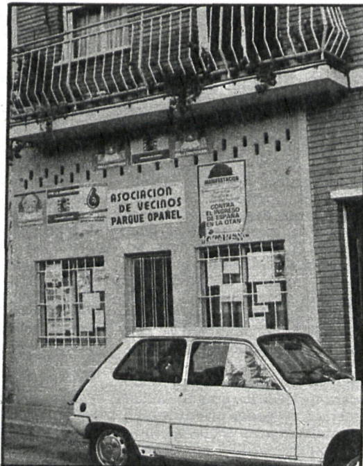
Los dirigentes de la Asociación se han enfrentado al concejal del distrito de Carabanchel, pero señalan la necesidad de cooperar y de mantener la amistad que como representantes de los vecinos deben demostrarse mutuamente

«Este año tenemos cuatro equipos de fútbol en el torneo de la Junta, pero el año pasado tuvieron que jugar en Villaverde. Nosotros no tenemos campos ni para entrenar, ade-