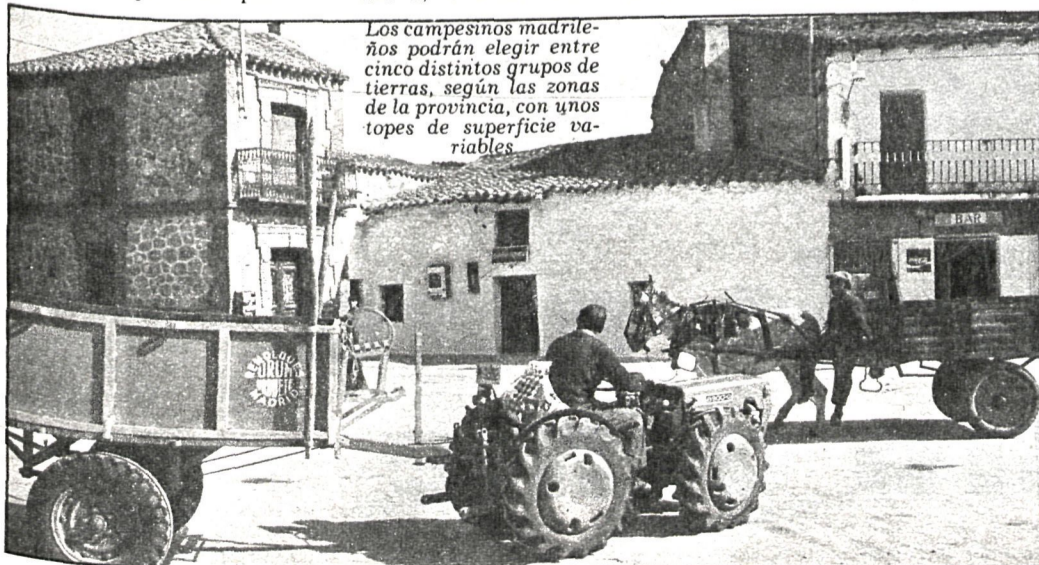
Los campesinos madrileños podrán elegir entre cinco distintos grupos de tierras, según las zonas de la provincia, con unos topes de superficie variables