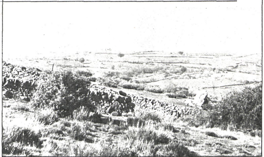
Las tierras de nuestra región se podrán arrendar por un periodo de hasta veintidós años, cifra que para los arrendadores se considera excesiva porque impide la «movilidad» de las fincas