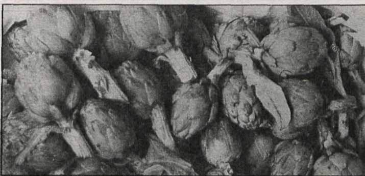
La eliminación de intermediarios permite obtener mayores beneficios de la producción de alcachofa

funciona desde hace más de diez años, con excelentes resultados: ya comercializa casi el 50 por 100 de la producción de alcachofa en Madrid