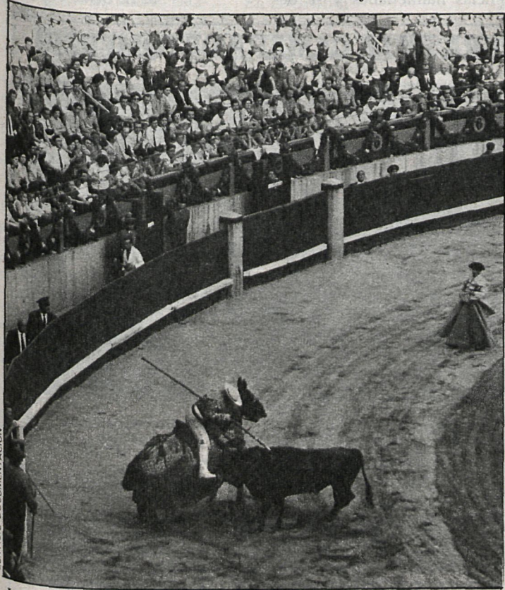
La plaza de San Martín de la Vega se pondrá a la altura de los grandes cosos taurinos

Un flojo nivel y una participación inferior a otros años es el resultado de estos campeonatos provinciales para la categoría juvenil, en que lo más destacable puede ser las cuatro mínimas que se realizaron en la altura femenina, mínimas para el nacional. En altura masculina, Tomás Mayo saltó dos metros, y destacar también la alta participación en 60 metros lisos, 300 y longitud masculina.