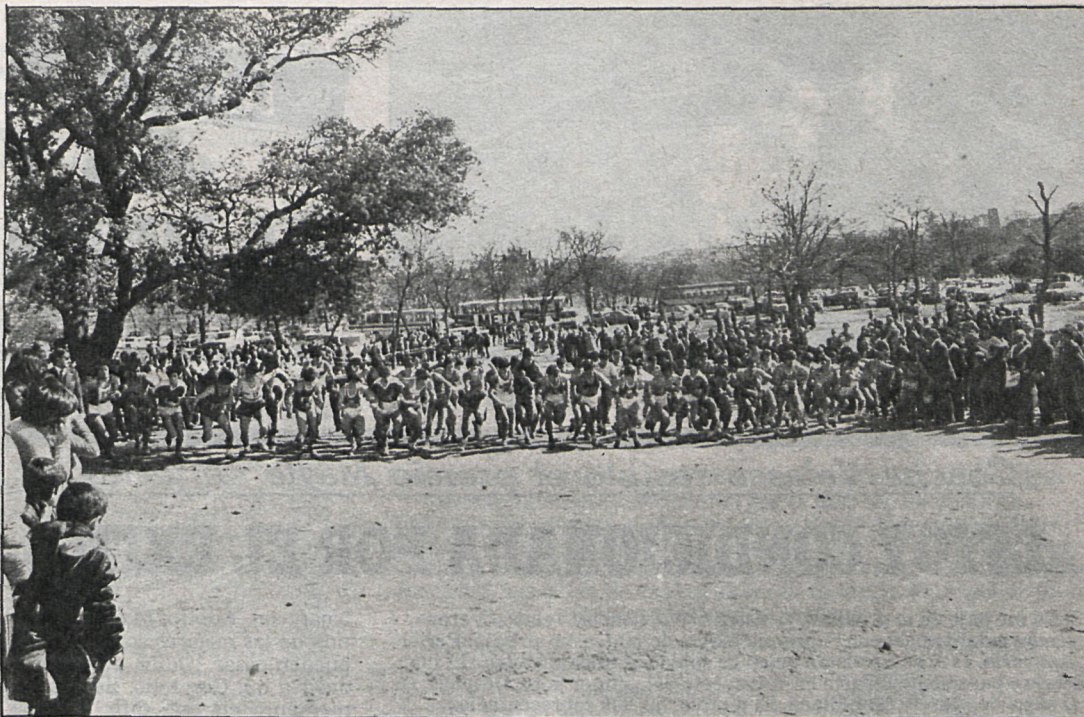
Los atletas nada más darse la salida

Hay que decir también que la organización fue perfecta; a los pocos minutos de terminar una prueba ya se tenían los resultados con sus tiempos. Mucho público en la llegada y en los alrededores del circuito, y una temperatura de verano, lo cual favoreció al espectador, no así a los corredores, que tuvieron que hacer un mayor esfuerzo por este hándicap. Hubo premios para los dos primeros de cada categoría y medallas.