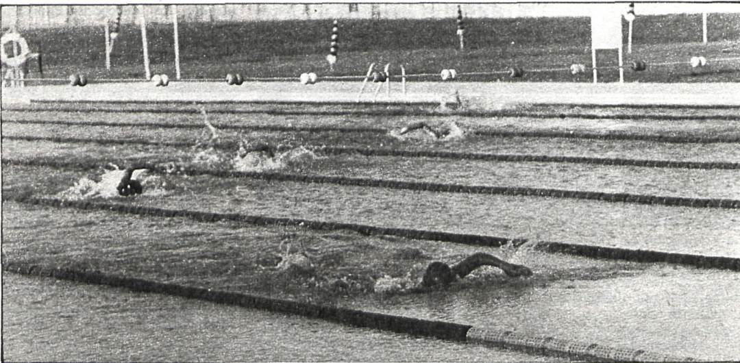
La creación por parte de los ayuntamientos de numerosos complejos deportivos —la piscina que vemos pertenece a Alcorcón— facilita la práctica de esta actividad y la consecución de buenos resultados en las competiciones

CIEMPOZUELOS-ARANJUEZ.— Tenemos noticias oficiales de que este partido se ju-