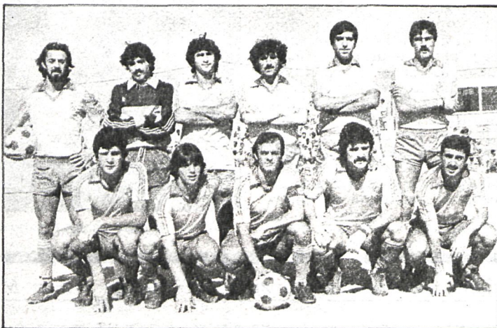
El Alcorcón, que vemos en la fotografía, no está dispuesto a permitir a sus vecinos de Móstoles que le arrebatan un solo punto

Ocupa los últimos puestos de la tabla, como consecuencia de una pésima campaña que le va a resultar muy difícil superar