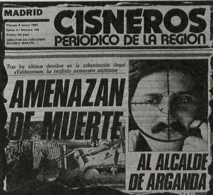
CISNEROS dio cuenta de las amenazas sufridas por el alcalde de Arganda en su número del 8 de enero

los últimos días como apoyo al alcalde y definición en cuanto a Valdecorzas.