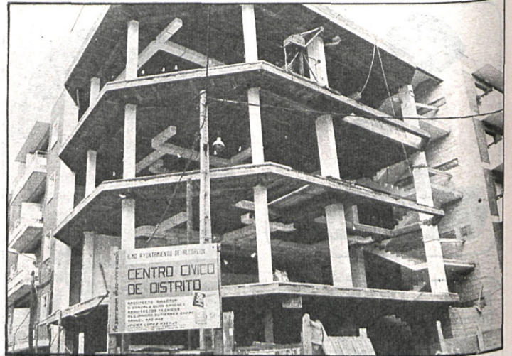
Centro cívico: Dentro de pocos meses abrirá sus puertas