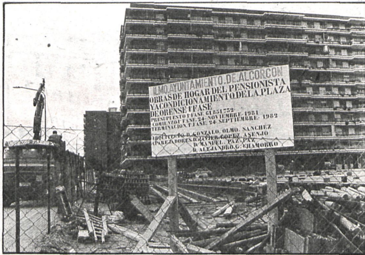
Los 12.000 ancianos de Alcorcón podrán disfrutar del Hogar del Pensionista

Esta interesante exposición podrá visitarse todos los días laborables de seis a nueve de la tarde y los sábados y festivos entre las once y trece horas.