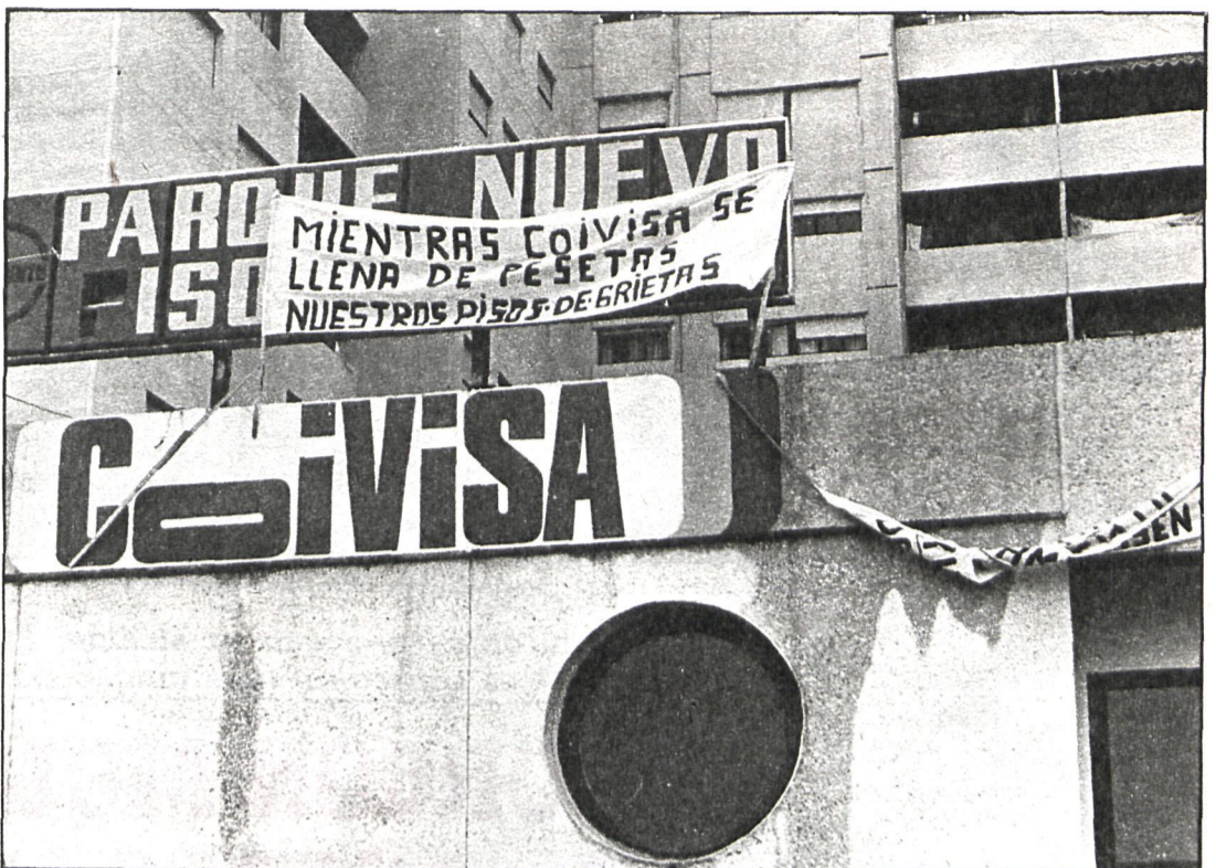
La foto pertenece a Covisa, otra urbanización de Fuenlabrada, cuyos vecinos acusan de tener graves deficiencias según informamos la pasada semana. El Ayuntamiento quiere evitar que en Chasa-2 se produzcan los mismos problemas

Por iniciativa del Ayuntamiento de Fuenlabrada