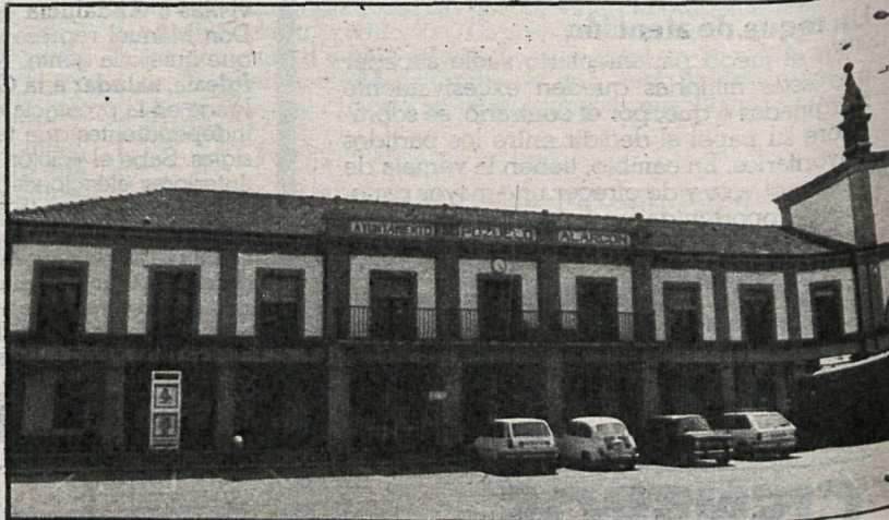
El Ayuntamiento de Pozuelo de Alarcón tiene este año un presupuesto de 600 millones de pesetas, frente a los 422 del año 81