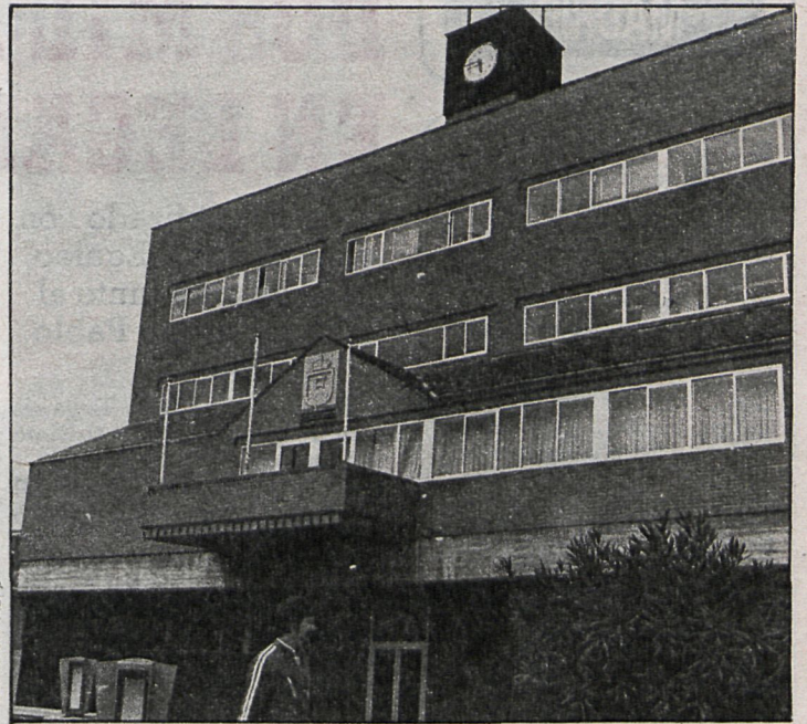
El Ayuntamiento de Alcorcón ha organizado la Fiesta de la Primavera para conmemorar el tercer aniversario de la celebración de las elecciones municipales

En Alcobendas —partido judicial de Colmenar Viejo—, el día 3 de abril el Ayuntamiento y los vecinos visitarán las obras en realización de la avenida España, Ruperto Chapí, plaza y zona deportiva de la