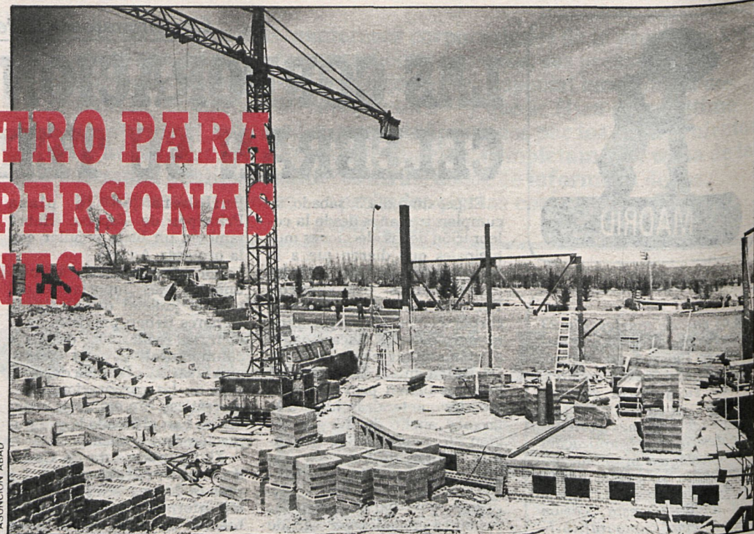
Estado actual de las obras, que como puede observarse van a buen ritmo

En el parque Pablo Picasso, de cuarenta mil metros cuadrados, se instalará también el monumento al trabajador, realizado por el escultor Sergio Castillo. Tendrá aproximada-