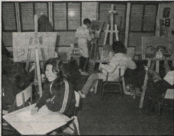
Las actividades culturales han sido potenciadas por todos los ayuntamientos madrileños

En 1982 el Ayuntamiento de Majadahonda no va a hacer