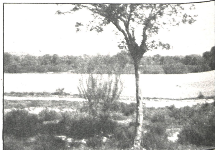
Esta es la finca «Sotomayor», de 1.300 hectáreas, de las cuales 900 son de regadío

Por la reducción del número de puestos de trabajo