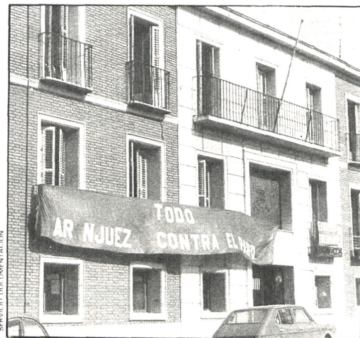
La lucha contra el paro no es un fenómeno de hoy en Aranjuez. La foto reproduce la fachada del Ayuntamiento durante un encierro que tuvo por escenario la Casa Consistorial

Tras llegar a la finca «Sotomayor», los vecinos penetraron sin problemas, y ya dentro (había unos cincuenta campesinos parados) salió el ingeniero señor Mazón. Interrogado por un colega de la prensa, el