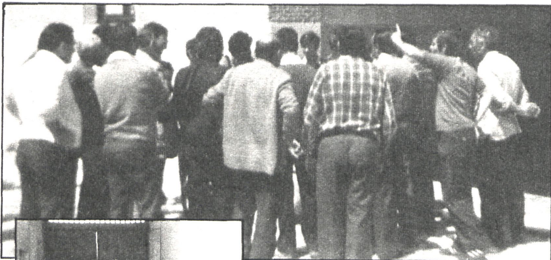
Los parados, durante la ocupación de la finca, plantean sus reivindicaciones

El grave problema del paro preocupa no sólo en zonas donde ha golpeado secularmente, como en Andalucía, sino en otros muchos puntos de la geografía española. En el caso concreto de Aranjuez, los niveles de desempleo son ya significativos, lo que ha provocado que quienes se ven afectados por este mal lleven a cabo acciones, en ocasiones desesperadas. En este contexto se inscribe la ocupación por parte de un grupo de parados de Aranjuez de la finca «Sotomayor», propiedad del Patrimonio Nacional, con el propósito de mostrar su disconformidad con la reducción del número de personas que allí estaban empleadas.