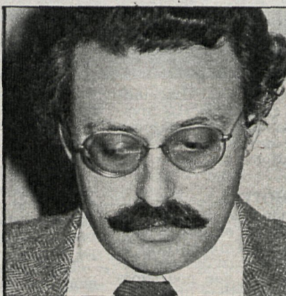
Joaquín Leguina, secretario general de la Federación Socialista Madrileña