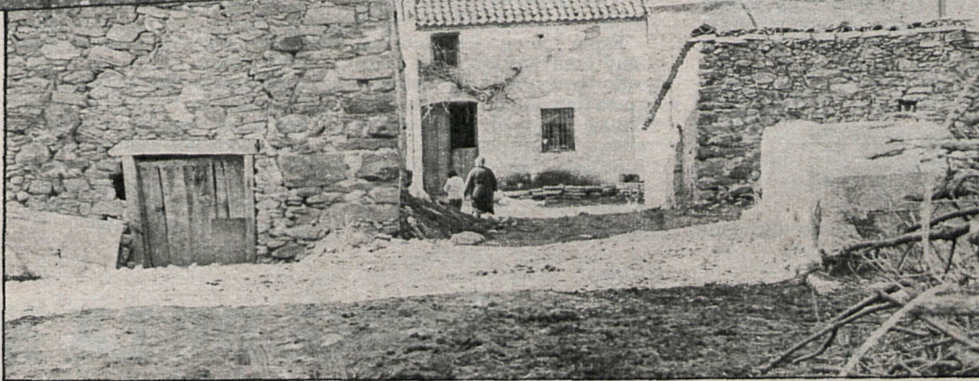
En total el número de municipios incluidos en el plan es de 87, con una población por encima de las 100.000 personas y unas 11.000 explotaciones

Con unas subvenciones que se sitúan en torno al 40 por 100 de media, las actuaciones concretas se centran en unas 20.000 hectáreas, destacando, entre otros, los siguientes objetivos: mejora de pastizales, aclareo de 8.000 hectáreas para el ganado, repoblación de 5.000 hectáreas, construcción de 50 centros recreativos, 60 kilómetros de caminos, trabajos selvícolas en 2.500 hectáreas, construcción de 50 charcas, 50 presas de riego, 200 refugios, 30 centros ganaderos, primas al ganado autóctono, núcleos de control lechero, etc.