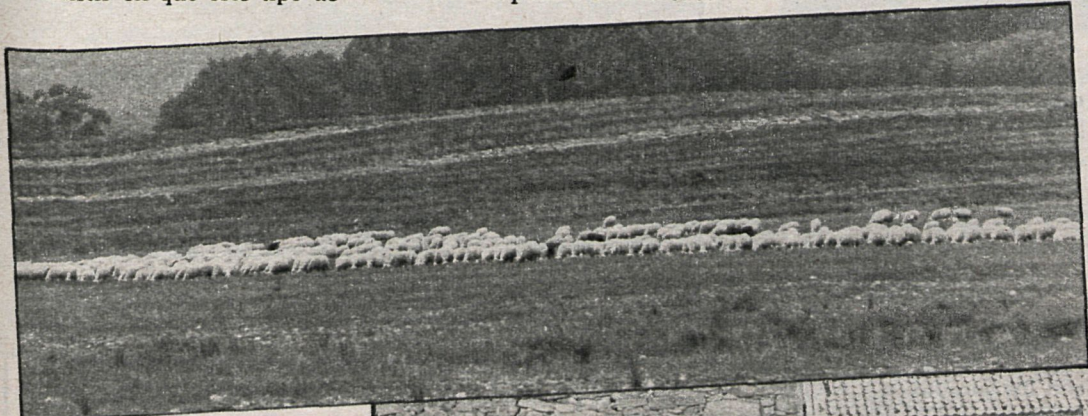
El proyecto afecta casi exclusivamente a zonas ganaderas y forestales, y próximamente se redactará otro para las comarcas agrícolas

planes son normales dentro de la política del Ministerio en todas las provincias, la realidad es que en muchos de sus puntos se puede producir el riesgo de duplicidad de actuaciones sobre otras que ya está realizando la Diputación Provincial desde hace varios años. Desde esta perspectiva, al igual que en otras actuaciones recientes de este departamento, no es difícil detectar un carácter electoralista a través de este proyecto.