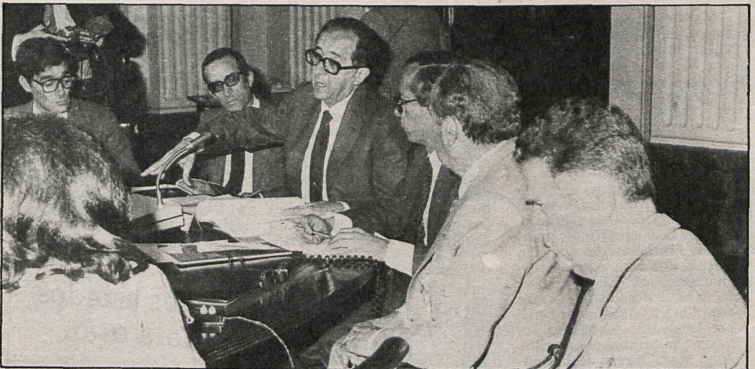
En el centro, frente al micrófono, José Luis Alvarez, ministro de Agricultura, Pesca y Alimentación, durante la presentación del plan a los medios informativos

Partiendo de esta realidad, con un medio rural marginado y una calidad de vida en la mayor parte de los municipios en regresión, desde 1978 se iniciaron por parte del Ministerio de Agricultura los proyectos para este Plan que definitivamente se ha puesto en marcha.