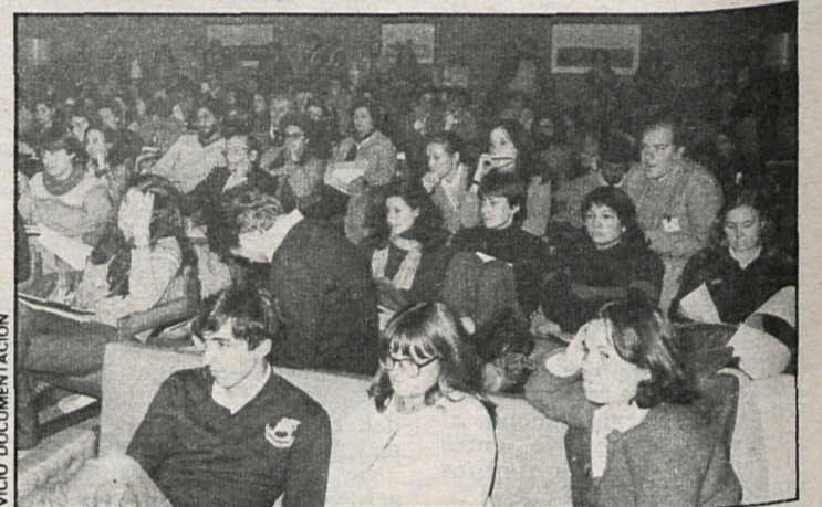
Los contratos temporales aliviarán, aunque en pequeña medida, la difícil situación de muchos jóvenes