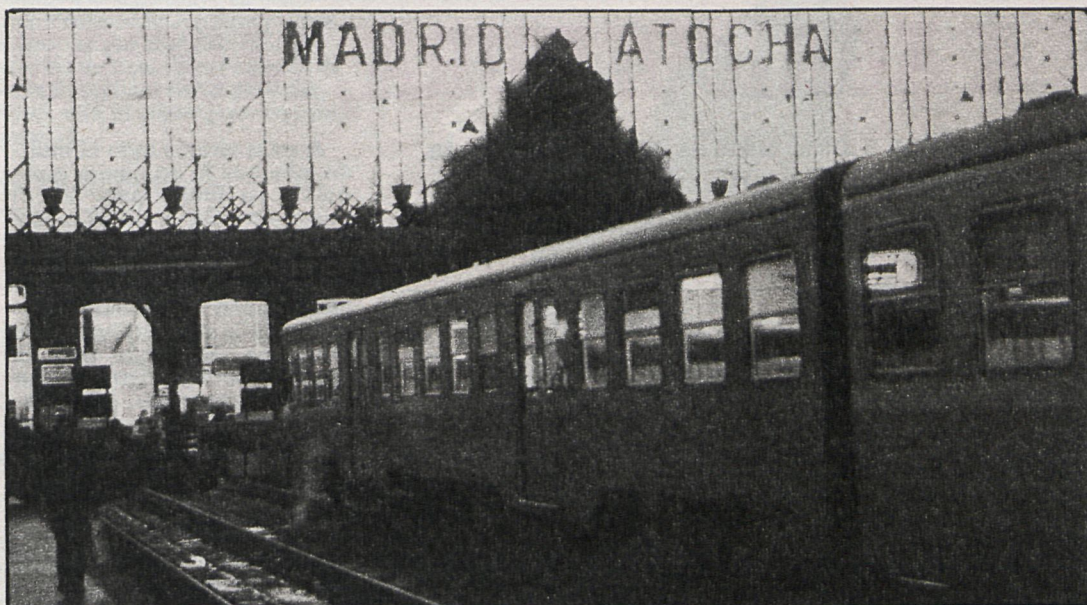
Atocha aún no se ha preparado para convertirse en el gran nudo de comunicaciones por tren con la periferia sur

En 1982 tenían que haberse invertido ya 2.600 millones de pesetas, de los 7.630 millones de pesetas previstos para este año, en la readaptación de la estación de Atocha, al Plan de cercanías, pero esta readapta-