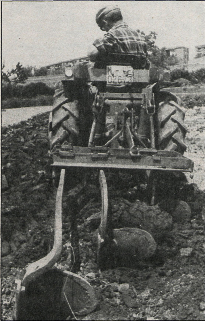
La modernización de la maquinaria es un elemento fundamental para cambiar este importante sector

Los créditos a bajo interés ofrecidos por la Administración no sirven para adecuar el sector de cara a nuestro ingreso en el Mercado Común