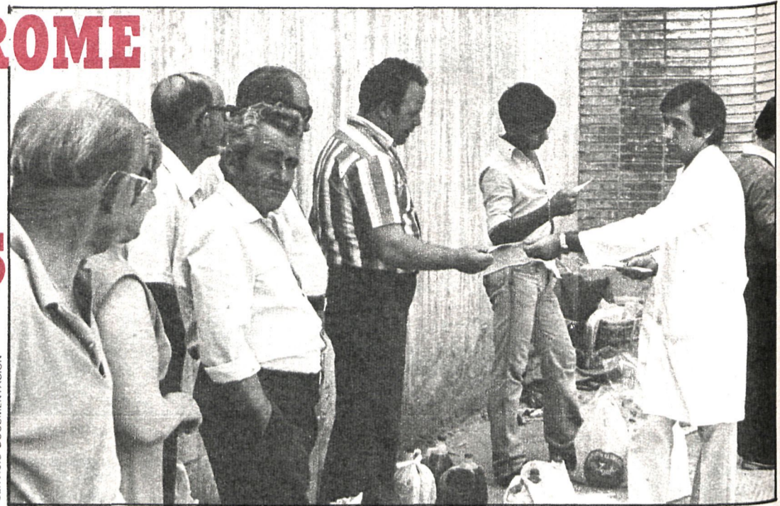
Pese a la campaña de recogida del aceite tóxico, éste dejó su huella en Leganés

En su elaboración han intervenido, ya sea directa o indirectamente, muchos de los profesionales que han trabajado en esta enfermedad desde su comienzo. Como fuentes de información se ha tomado el censo de enfermos elaborado por funcionarios del Ayuntamiento a través de encuestas y el registro de afectados de la unidad de seguimiento de Leganés. El número de enfermos hasta el 1 de mayo de este año se elevó a 1.032, siendo 16