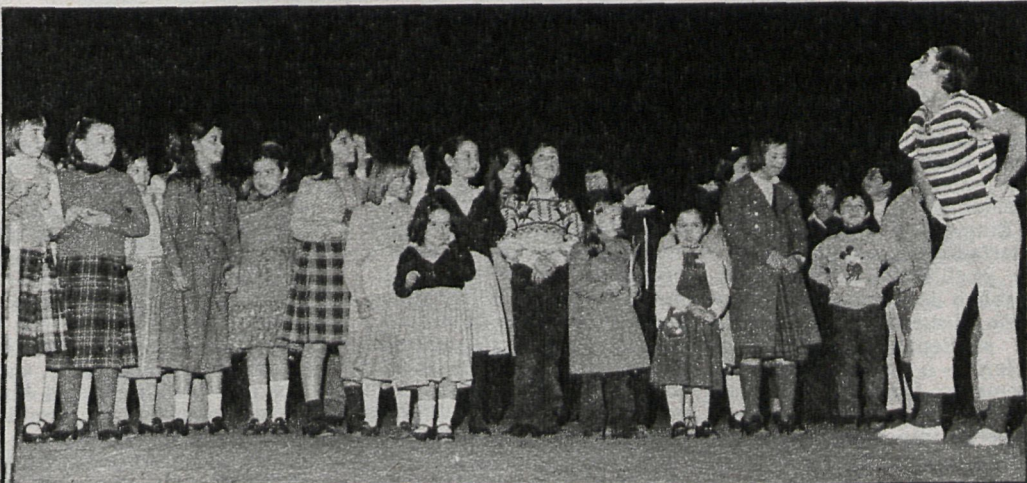
Los peques de Fuenlabrada pudieron acercarse al mundo del teatro

El colectivo actualmente está compuesto por cinco miembros cuya actividad en el campo de la animación cultural se inscribe dentro del magisterio, la dinamización de grupos y las actividades culturales.