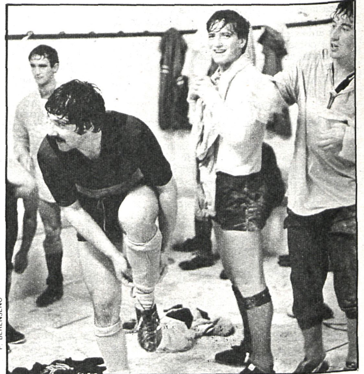
La camaradería entre los jugadores, el compañerismo, ha sido un factor clave en la victoria