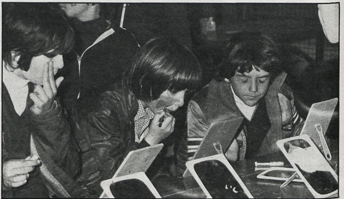
Los Centros Urbanos de Ocio se han instalado provisionalmente en los colegios, por falta de locales adecuados, lo que no impide a los niños disfrutar «a tope» de su tiempo libre

La experiencia, puesta en marcha por el Servicio de Ani-