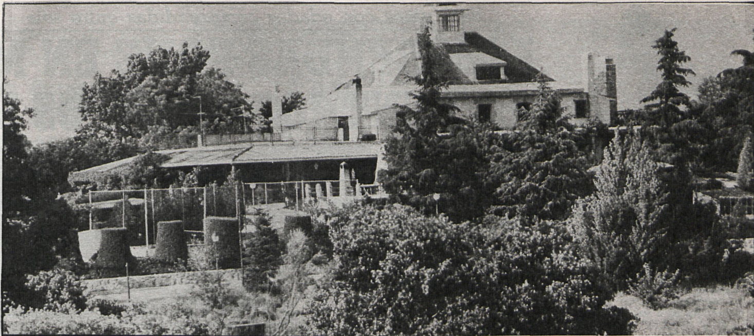
La actualización del censo de contribuyentes de Boadilla pondría al descubierto a quienes poseen auténticas mansiones y sólo tienen declarado el solar

Estos talleres se complementarán con otras actividades, que van desde cine, charlas, baños en piscina municipal, deportes de competición, teatro, hasta la instalación de un campamento. El primer viernes de cada quincena habrá una excursión a la sierra, y el segundo, como final de la colonia, una gran fiesta. Los precios de las colonias son de dos mil pesetas, o de tres mil, en caso de que los niños prefieran quedarse a comer.