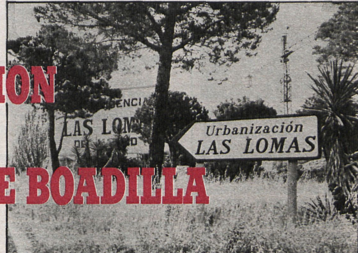
En Boadilla existen numerosas urbanizaciones de lujo. En la foto, la entrada a Las Lomas

que firmó un contrato y protocolo con la Diputación, acordado en un pleno celebrado el pasado 3 de febrero y ratificado por el director del Programa de Promoción Recaudatoria (PPR) y el propio alcalde el 26 de marzo, ha dado marcha atrás, sin duda presionado por los propietarios de los chalés de las urbanizaciones, particularmente los de Monte Príncipe y Bonanza, quienes desde el primer día de la recogida de datos, el 19 de abril, se han opuesto a esta medida. Incluso muchos de ellos, aproximadamente un centenar, han enviado sendos recursos al Ayuntamiento aduciendo que no procede el aumento de los impuestos porque los presupuestos municipales arrojan superávit todos los años.