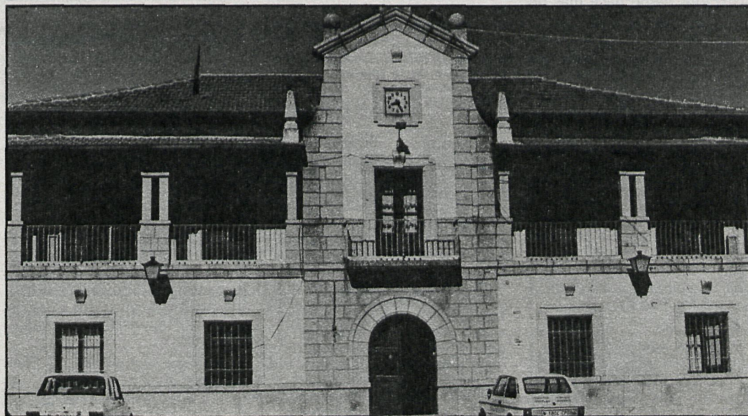
El Ayuntamiento de Los Molinos quiere erradicar definitivamente las infracciones urbanísticas existentes en el municipio

Pensamos enviar una carta a todos los vecinos y residentes recomendándoles que antes de comprar una parcela en nuestro municipio se informen antes en el Ayuntamiento.