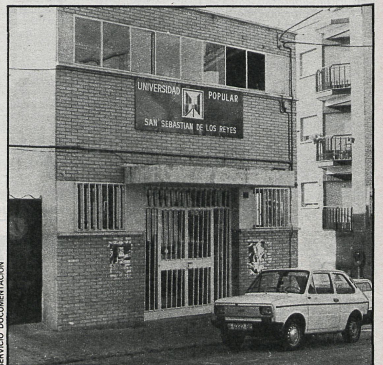
La Universidad Popular de San Sebastián de los Reyes fue la primera que abrió sus puertas en Madrid

ción de sus sistemas de financiación, ya que la mayor parte de estos organismos, financiados y creados a través de los ayuntamientos democráticos en base a la actual ley de Régimen Local, algunos cuentan con posibles e improbables ayudas económicas de órganos públicos, como las diputaciones, entes autonómicos y Administración Central, y otras instituciones de carácter privado, como empresas, Cajas de Ahorro y asociaciones privadas, además de las aportaciones de los alumnos. Asimismo quedó patente la necesidad de delimitar el marco jurídico y de crear una sólida base institucional a través de patronatos, juntas directivas y representación del alumnado en la constitución de los centros. En otro orden de cosas se puso de manifiesto la inestabilidad profesional de los profesores de universidades populares, que repercute en la calidad de la enseñanza y en la consideración profesional.