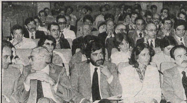
Todas las jornadas contaron con una nutrida asistencia, como puede verse en esta foto, que refleja uno de los momentos de las Jornadas Radiológicas sobre Vías Biliares y Páncreas