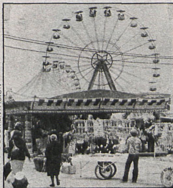
El programa quiere dar a conocer todos los aspectos de la vida en los pueblos, desde las fiestas al patrimonio artístico

Radiocadena Castilla está en contacto con todos los ayuntamientos, informando de todas sus actividades a la par que de todo aquello que va ocurriendo