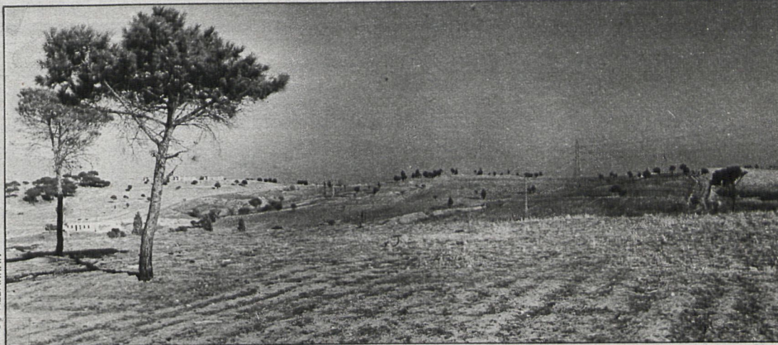
1.507 hectáreas dedica el nuevo plan de Pozuelo a suelo no urbanizable por sus valores agrícolas, ecológicos o paisajísticos

En el estudio se recogen los errores existentes en la actual