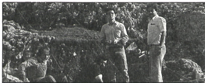
Miembros del departamento de paleontología de la Universidad Complutense, autores del hallazgo, en la zona de las excavaciones

El motivo del encuentro era dar a conocer las muestras encontradas a todos los vecinos del pueblo, a través de una