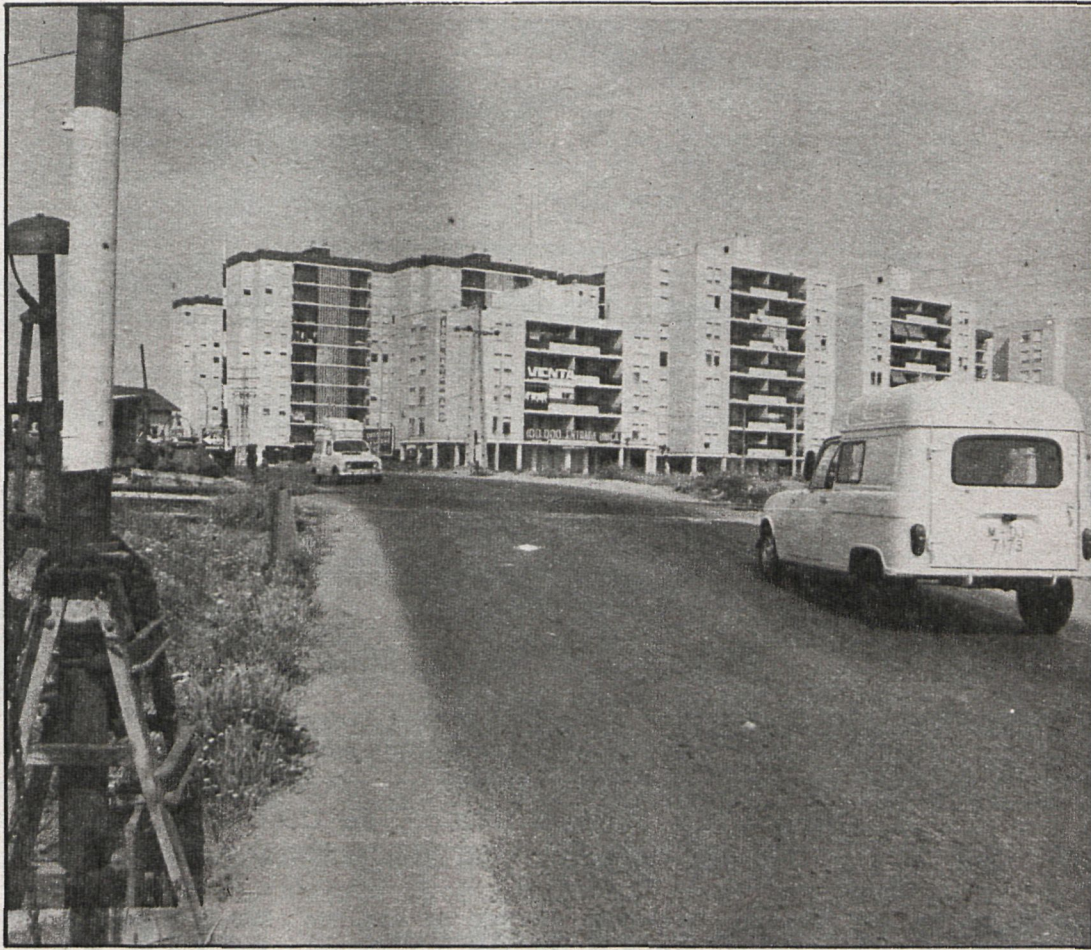
Las viviendas adquiridas en urbanizaciones de nueva construcción están exentas de pagar los llamados «derechos reales», que es lo que reclaman los vecinos de Fuenlabrada

Según un decreto de 1980, tienen derecho a ello las personas que compraron un piso en urbanizaciones de nueva construcción