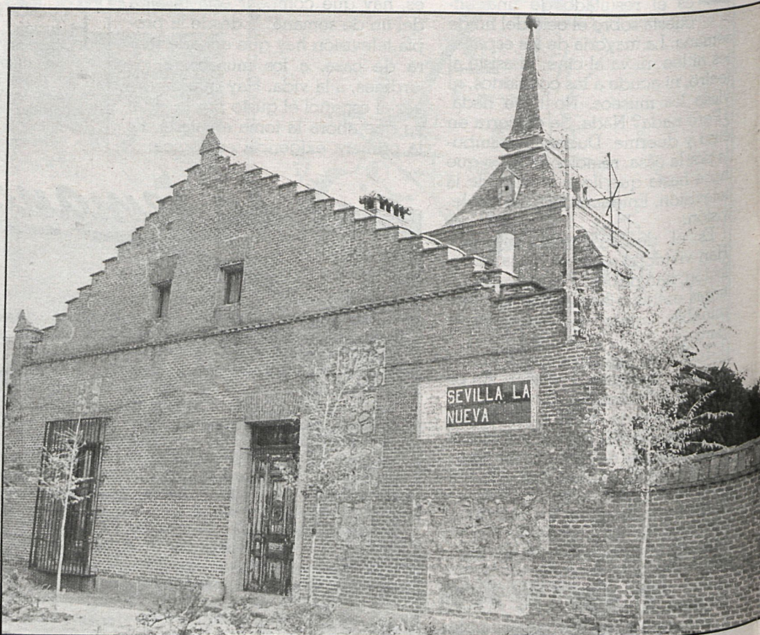
«La Casa Grande» de Sevilla la Nueva data del siglo XVI. En la foto, uno de los laterales del palacio

Se instalará en el palacio denominado Casa Grande, que acaba de adquirir la Diputación de Madrid