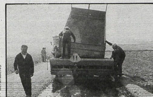
La red viaria provincial ha experimentado una importante mejora en los últimos años