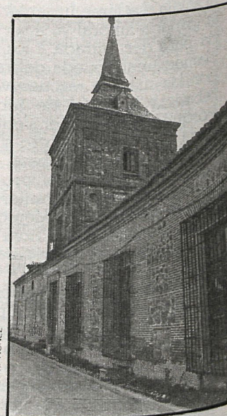
Fachada principal del futuro Museo Etnológico