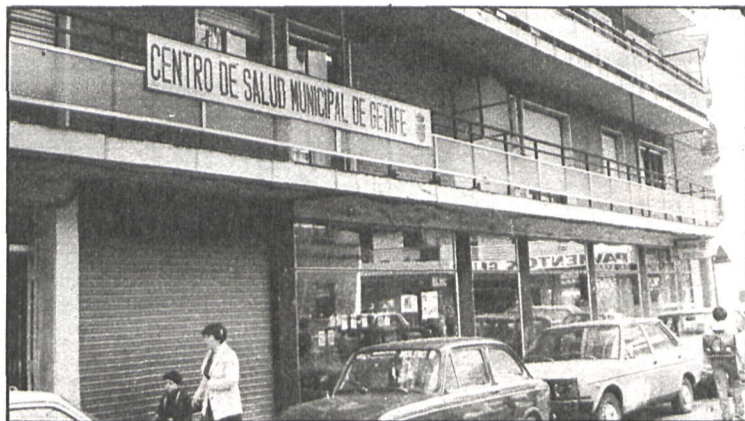
Casa de la Juventud, biblioteca y centro de la salud, son resultado de la labor municipal