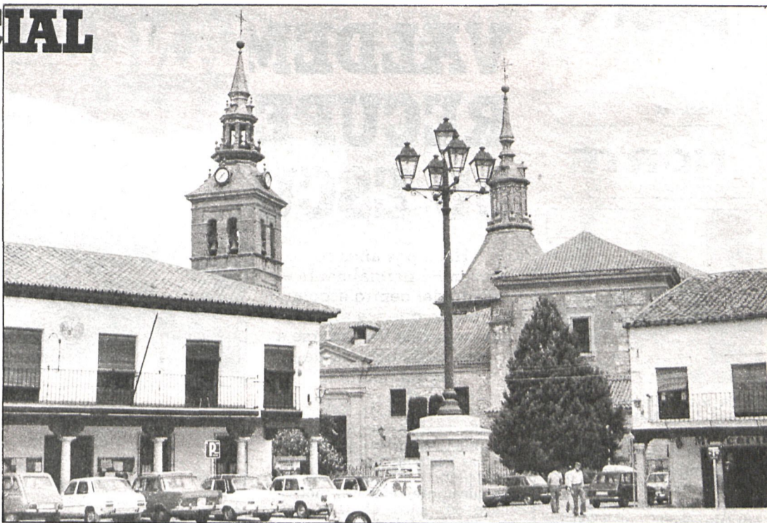
Navalagamella experimentará un moderado crecimiento con la construcción de las nuevas viviendas

que CASRAMA, y por mediación del MOPU, nos hiciese una acometida de aguas no solamente para este pueblo, sino para otros tres o cuatro más, con un caudal de agua, aproximadamente, para cuatro poblaciones más que la actual, ya que nosotros teníamos adjudicados seis litros por segundo y hemos pasado a veinticuatro litros por segundo. Además, hemos solucionado el problema de la construcción, ya que COPLACO no nos dejaba edificar por no tener agua. Llevábamos más de diecisiete años sin médico, y en un pueblo donde vienen en la época veraniega más de 2.000 personas de Ma-