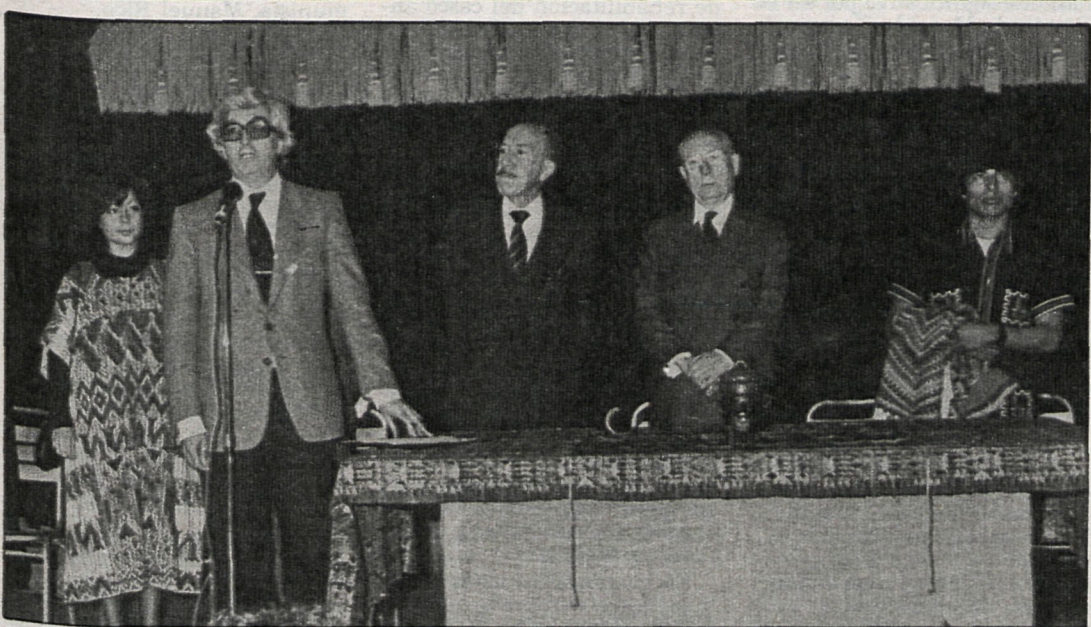
El presidente de la Diputación de Madrid, en un momento de su intervención. A su izquierda puede verse al alcalde de Madrid, señor Tierno Galván.