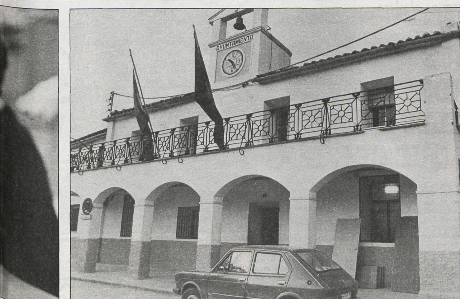
Las urnas decidirán la composición de las futuras Corporaciones municipales madrileñas

La novedad más importante respecto a estas listas es que el PSOE admitirá a independientes para elaborar las candidaturas. Las primeras encuestas