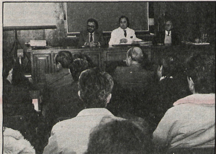
El curso tiene como objetivo normalizar y homogeneizar las funciones de estos agentes en los municipios

Al curso asisten 35 personas, pertenecientes a los laboratorios de Alcobendas, Alcalá de Henares, Aranjuez, Fuenlabrada y Getafe, donde actualmente desarrollan funciones como policías municipales, inspectores de abastos o auxiliares técnicos de laboratorio.