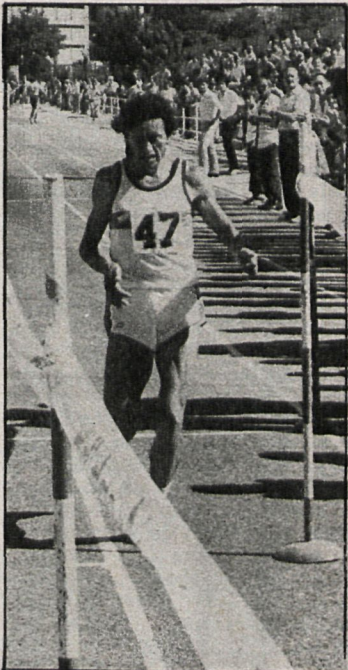
El interés por las competiciones atléticas está aumentando a nivel popular