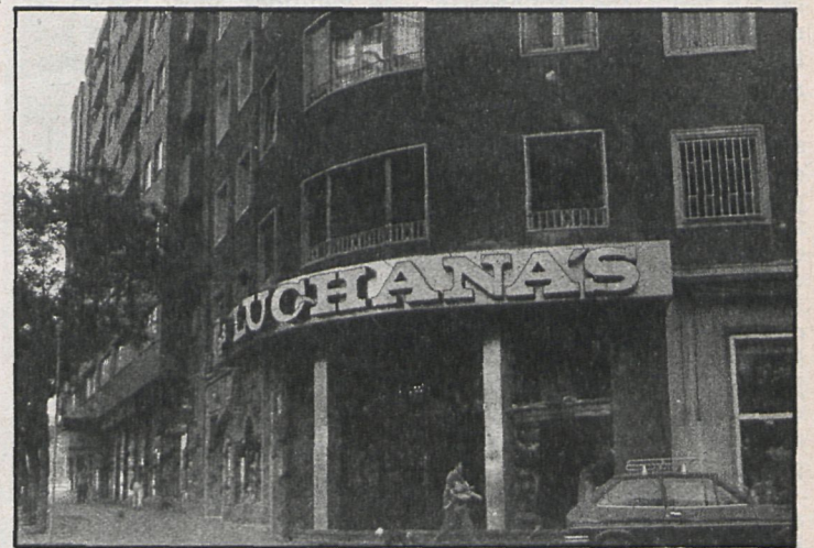
Las salas madrileñas aprovechan la época para programar reposiciones que en muchos casos representan una grata sorpresa para los amantes del séptimo arte

descubrir lo que ya está descubierta tiempo ha.