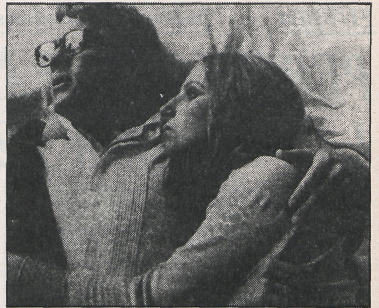
«¿Qué me pasa, doctor?» es una comedia inolvidable que vuelve a nuestras pantallas

Su director, Peter Bogdanovich, siempre me cayó simpático. Por varias razones. La primera es que es un tipo modesto. Le gusta hacer películas de género, sin meterse en mayores honduras, con una rara perfección. Además, se ha pasado buena parte de su vida absorto ante la pantalla, lo que le ha dado la humildad suficiente como para no querer