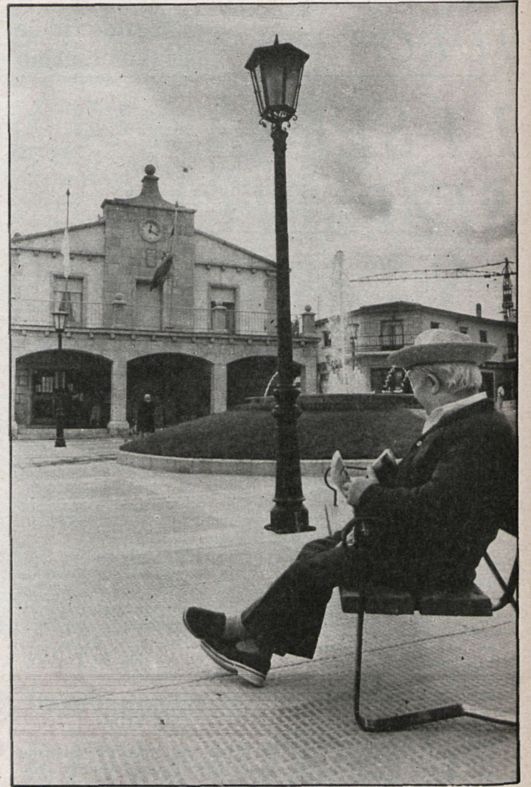
Más del 90 por 100 de los ancianos quedan abandonados a sus exiguos recursos una vez llegada la jubilación

Hay composiciones admirables: «La tarde lleva un delirio