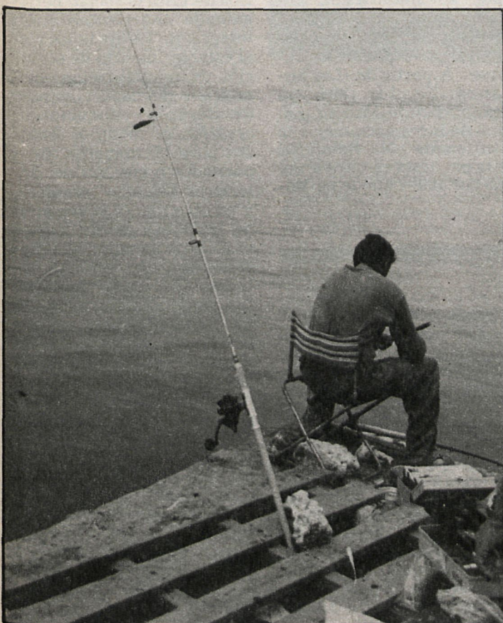
Con la llegada del verano, el mar se convierte en escenario cotidiano para los pescadores

terminaba a primeros de agosto. La firma del nuevo contrato se produjo ayer jueves en la sede del Gobierno autónomo de Madrid. Madrid Toros, S. A., ha explotado el coso madrileño por espacio de tres años consecutivos, que ahora han expirado, y seguirá al frente de las Ventas durante la próxima temporada taurina.