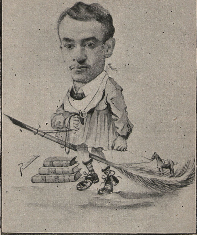
G. MARTÍNEZ SIERRA

Martínez Sierra, el autor de El Poema del Trabajo , ca[hoy en el terreno de las letras su segunda batalla con un nuevo tomo, Diálogos fantásticos , que van precedidos de un hermosísimo prólogo del maestro Rueda, el gentil favorito de la musa andaluza.