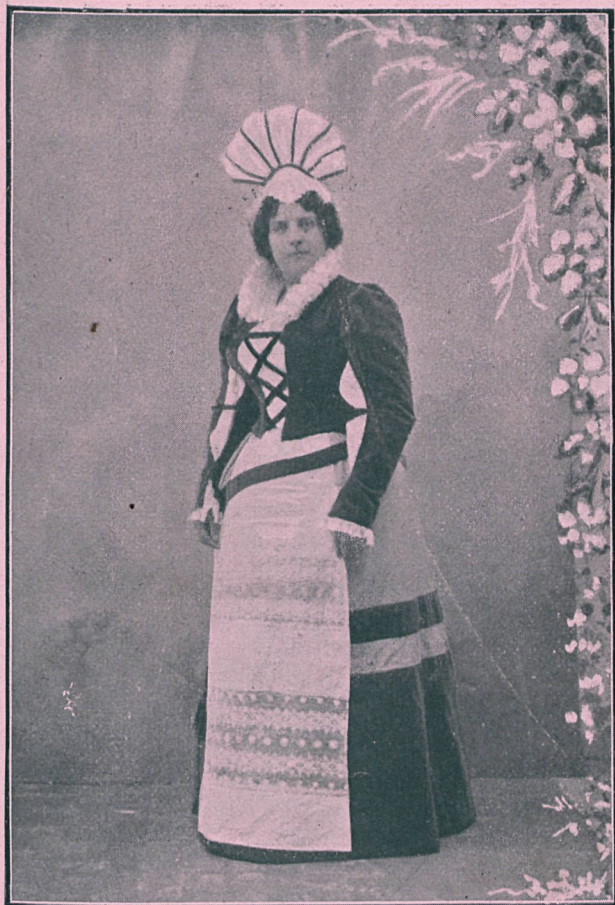
JOAQUINA PINO Distinguida tiple del teatro de ... olo.