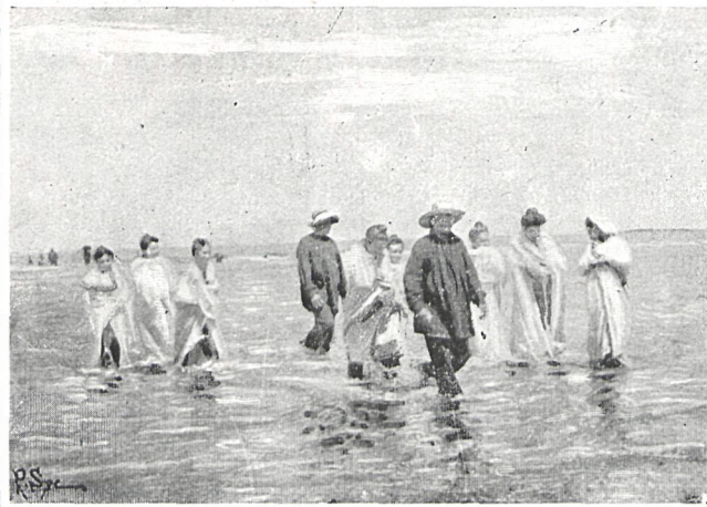
PLAYA DE DEVA. — Saliendo del baño.