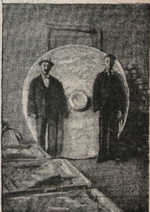
El rey de los melones.