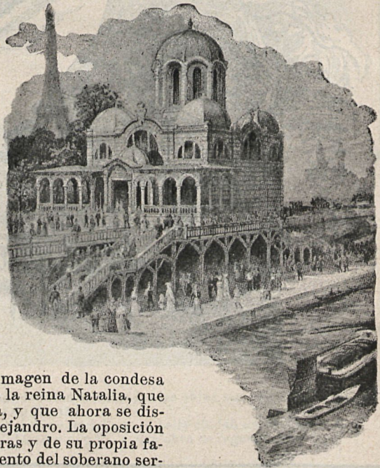
Pabellón de Servia.

Lo que exhibe Servia es, en su mayor parte, producto de industrias musulmanas, tapices, aplicaciones de metal sobre sederías, incrustación en maderas, algunos damasquinados y una instalación de fotografías notable, en la que llaman principalmente la atención los retratos del ex-rey milano Obrenowitch, tan conocido entre la alegre sociedad de París, y el de su hermosísima mujer, la rusa reina Natalia, que todos conocen y admiran en San Sebastián y Biarritz. De uniforme, de paisano y con el traje del país está retratado el joven rey Alejandro, y en paraje no lejano hállase reproducida la imagen de la condesa Carlota Draga Maschin, antigua dama de la reina Natalia, que ha viajado con ella por Francia y España, y que ahora se dispone á compartir el trono con el joven Alejandro. La oposición de la política, de algunas cortes extranjerías y de su propia familia, no ha logrado vencer el apasionamiento del soberano serbio, que será un joven cuando su futura haya llegado á la vejez. Para entonces el amor dejará de ser ciego, y la hoy triunfadora condesa sufrirá el más sensible de los destronamientos.