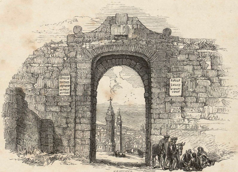
Arco de los Gigantes, Antequera.

¡ Cuan solitaria la nacion que un dia Poblara inmensa gente ! ¡ La nacion cuyo imperio se estendia Del Ocaso al Oriente ! Lágrimas viertes, infeliz ahora, Soberana del mundo, ¡ Y nadie de tu faz encantadora Borra el dolor profundo !—ESPRONCEDA.