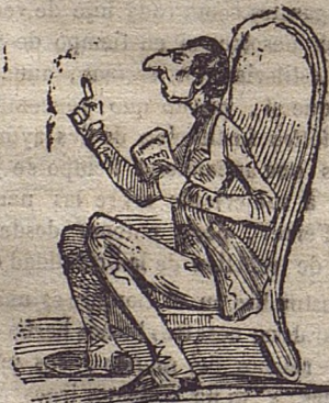
Acusacion hecha en el jurado contra el Cangrejo, por el Ciudadano Particular D. Gil de las Calzas verdes.

Dignísimo jurado, ante vos un fiscal destrabillado, franciendo el entrecejo