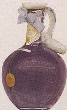
No. 275. Jarra griega. 6 Ptas.

Violeta — Ideal — Trébol — Clavel Lilas — Lavanda — Azahar — Verbena