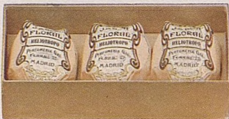
No. 48. Jabón Floral. Caja 2 Ptas. Pastilla 0.75.