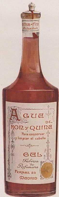
Agua de Ron y Quina extrafina