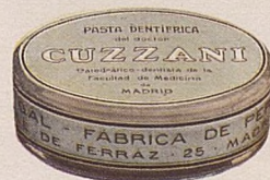
No. 489. Pasta dentífrica. 1.50.