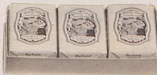
No. 387. Jabón de Lanolina.