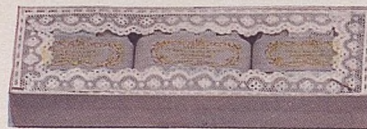
No. 62. Jabón de Violetas Reales.