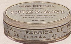
No. 488. Polvos dentífricos. 1 Pta.