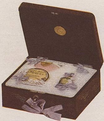
No. 479. Estuche Cleo. 5 Ptas.