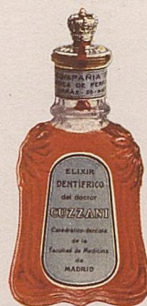
No. 487. Elixir dentífrico. 1 Pta.