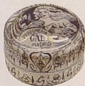
No. 503, Vaselina Ideal 0.10.