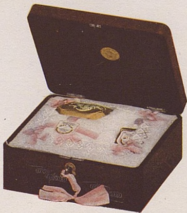
No. 475. Estuche Nélia. 7.50.