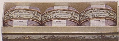
No. 3. Jabón Gal. Caja 2.75. Pastilla 1 Pta.

Violeta. — Heliotropo. — Piel de España. Alhambra. — Ideal. — Trébol.