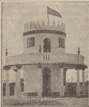
COLONIA MONTE CARMELO Plaza de la Victoria.—EL TORREON

Barquillo, 32, y Fernando VI, 14.-Teléfono 34.265.-MADRID