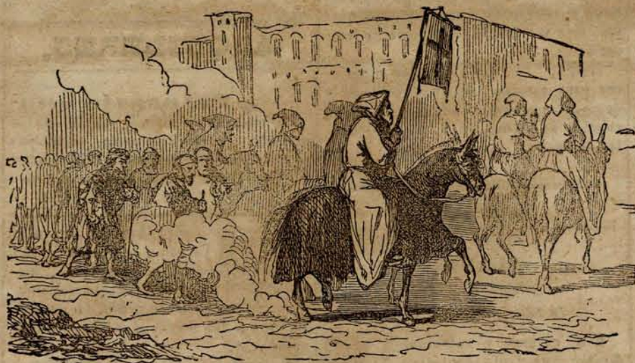
ERA EL DIA DEL SANTO PATRON DEL PUEBLO.